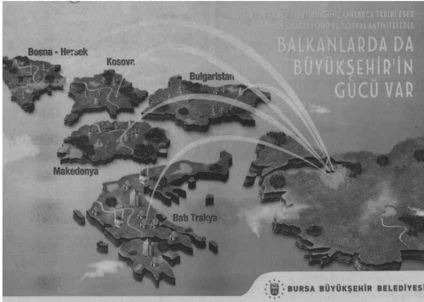
Şekil 2. Bursa Büyükşehir Belediyesi Reklamı, Balkan Günlüğü , 9 Şubat 2015.

Merkezin söyleminin farklı şekillerde üretilmesinin bir başka örneği de coğrafyalar arası kader birliği vurgusudur. Örneğin Bursa Belediye Başkanı Recep Altepe’nin “Kosova, Türkiye’nin bir parçası” ve Balkanlar ve Türkiye’nin “bütünün parçaları” olduğu söylemi, 83 Keçiören’in Saraybosna’daki Başçarşı’yla bir olduğu söylemi, Bilecik Belediye Başkanı’nın Bosna’nın ayrılmaz