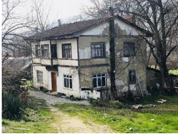
Şekil 24. Geleneksel yapıya ait sonradan yapılan eklentiler