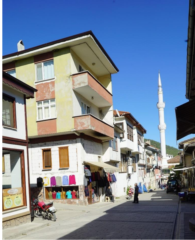
Şekil 3. Orhan Gazi Çarşısı sokağında bozulmuş yapı dokusuna örnek

Coğrafi yönden engebeli bir alanda kurulduğu ve ilçe merkezinin içinden de Göynük Çayının geçtiği bilinen Taraklı kentinde geleneksel dokuya sahip mimari yapılar kendi içinde eski yerleşim yeri ve Ankara Caddesi üzerinde ise oluşan yeni yerleşim yeri olarak ayrılabilir.