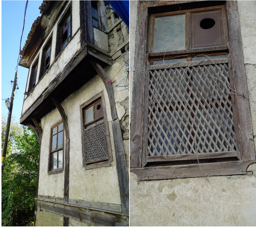
Şekil 14. Evlerde bulunan giyontin tek kanatlı ahşap kafesli pencere örneği

Zemin kat cephesi; bu katın depo olması nedeniyle oldukça sağırdır. Cephe üzerinde, demir parmaklıklı oda penceresi ya da saman pencereleri ve giriş kapısı yer almaktadır. Kapılar, çift kanatlı ve üstü pencerelidir. Kapı genişlikleri 150 ila 195 cm yükseklikleri 240-300 cm arasında değişmektedir. Pencereler dikdörtgen boyutlu olup genellikle giyontin ve tek kanatlı büyük pencerelidir.