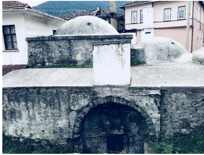
Şekil 6. Taraklı Yunus Paşa Hamamı genel görünümü

Ilıklık kısmının üstü beşik tonoz, sıcaklık kısmı ise kubbe ile örtülüdür. Hamamın dışında sivri kemerli bir külhan nişi bulunur ve üstünde ise bulunan tepe ışıklıklarıyla ortam aydınlığı sağlanır [2].