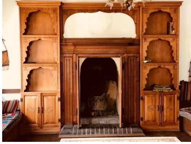
Şekil 12. Evlerin odalarında bulunan dolap ve ocak düzenine ait örnek.

Bahçe ya da sokak cephesi üzerinde yer alan mutfaklarda; ocak, lavabo ve sergenler bulunmaktadır. Bu mekanlar küçük pencerelerle aydınlatılmaktadır. Bazı konutlarda ise kuyular bulunmaktadır.