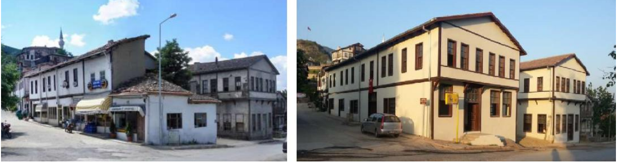
Şekil 8. Hacı Atf Hanı ( önceki ve restorasyon sonrası hali)

Hanın alt katında dükkan ve depolar, üst katında ise yalnız han odaları bulunmaktadır. Günümüzde restorasyonu tamamlanan hanın butik otel ve lokanta gibi kullanım alanlarıyla turizme katılması düşünülmektedir.