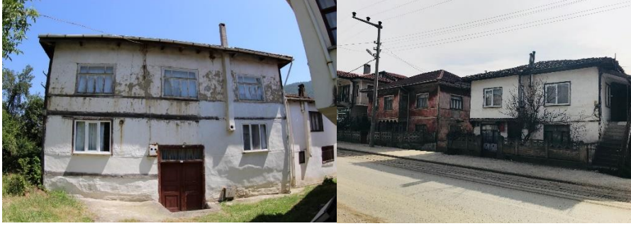
Şekil 19. Yapıya sonradan yapılan ilaveler ile yapı ilk formunun bozulması (pencere ve baca örneği)