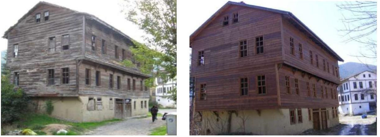
Şekil 10. Rüştiye Mektebi (önceki ve restorasyon sonrası hali)

1888 yılına ait Osmanlı Devlet Salnamesi ne göre Rüştiye Mektebi, yaklaşık 1800'lü yıllarda yapılmıştır. 1888, Osmanlı Devlet Salnamesindeki rüştiye öğrencileri sayısının düşük oluşu, Taraklı nüfusunun diğer bölgelere göç etmiş olduğunun bir ifadesidir [8]. Üç katlı olan yapı, bugün konut olarak kullanılmaktadır.