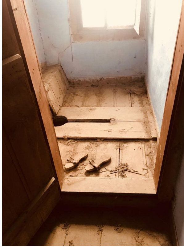
Şekil 13. Evlerde bulunan ahşap tuvalet örneği

Girişin solunda ya da sağında ise, üst kata çıkan ahşap merdiven yer alır. Birinci katlarda tuvalet ve odalar bulunur.