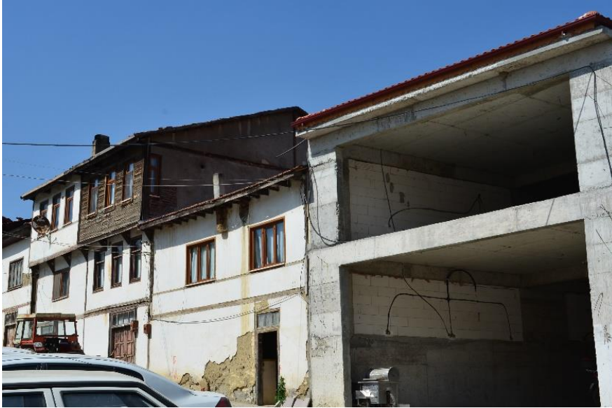
Şekil 20. Geleneksel ahşap çatıklı kerpiç evlerin yanında yer alan betonarme yapı