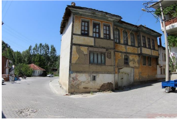
Şekil 23. Sokak yenilemesi esnasında oluşan kot farkı