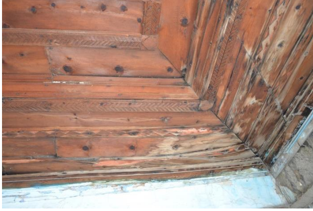
Şekil 25. Geleneksel bir yapının tavanına ait bozulmalar