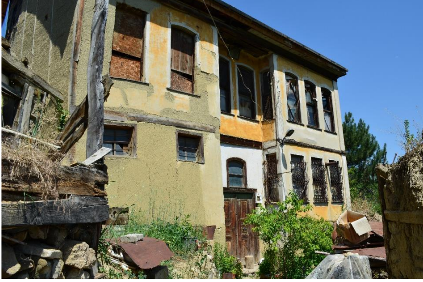
Şekil 18. Ev mirasçılara kalması ve evlerin bölünerek farklı kullanıcılara sahip olması neticesinde yapı formunun bozulması