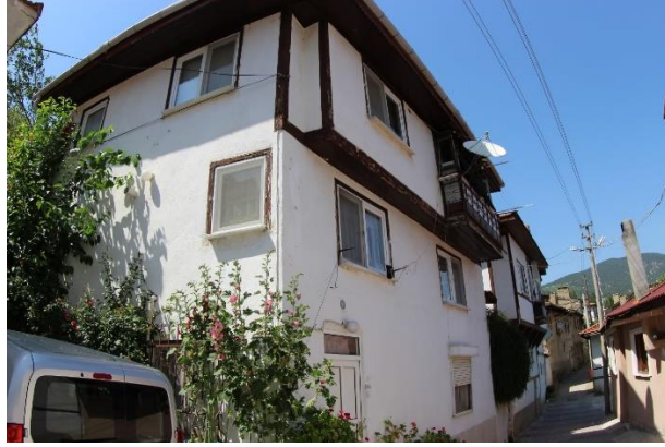
Şekil 22. Geleneksel evlerde sonradan yenileme esnasında aslına uymayan pencere