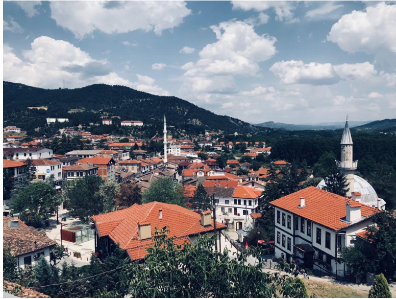
Şekil 2. Taraklı Kentinin genel görünümü (1987-2017)