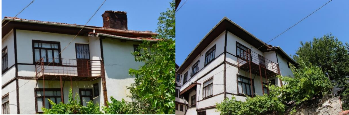
Şekil 17. Yapı bütünlüğüyle uyum sağlamayan sonradan eklenmiş balkon

Geleneksel konut yapım usullerini bilen ustaların azalması ya da hayatta olmaması sebebiyle sonradan konutlara yapılan müdahaleler, hatalı onarımları ve yanlış malzeme kullanımını tetiklemiştir. Onarımlar sırasında cepheler çimento harcı ile sıvanmış parapet ve kat silmeleri yok edilmiştir. Cephede olmayan yeni pencereler veya kapılar açılmıştır. Mevcut yapılarda kullanılan kerpiç malzemeye ek olarak yapılara sonradan dahil edilen eklentilere tuğla taş vb. yapı malzemesi kullanılarak malzeme bütünlüğünün bozulmasının yanında yapının doğasına aykırı malzemeler kullanılmış bu durumda yapı stabilitesinin bozulmasına ve dolayısıyla sonradan yapıya gelecek ek gerilmelere neden olmuştur.