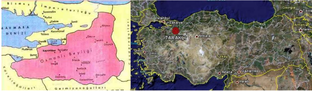
Şekil 1. Geçmişten günümüze Taraklı Kentinin haritası

Taraklı, Marmara Bölgesi'nde İstanbul-Göynük karayolu üzerinde yer alan ve tarihi dokusunu günümüze dek koruyabilmiş ender kentlerimizden biridir. Sakarya dan 65 km uzaklıktaki yerleşme, eski İstanbul-Ankara karayolu üzerinde, Göynük ve Geyve ilçeleri arasında kalmaktadır.