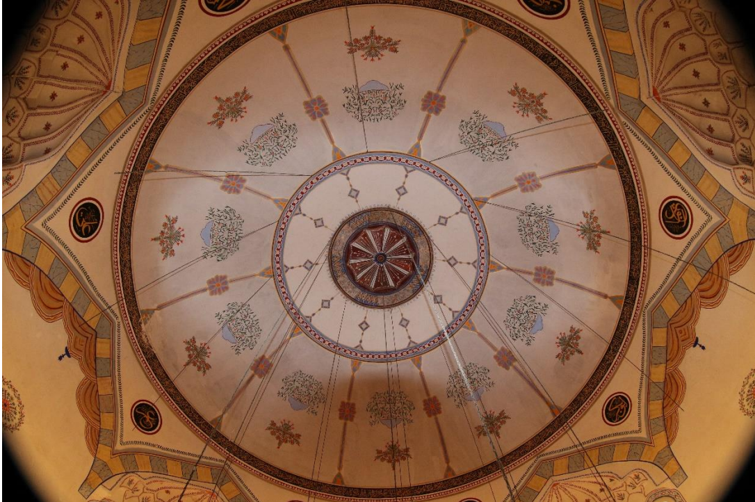
Şekil 5. Yunus Paşa Camiinden kalem işi ile süslenmiş kubbe görünümü