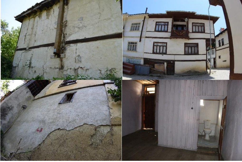
Şekil 21. Yapıya sonradan ilave edilen ancak yapının ilk haliyle uyuşmayan tesisat sistemleri