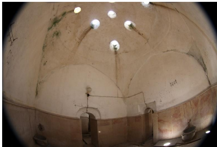
Şekil 7. Taraklı Yunus Paşa Hamamı iç görünümü