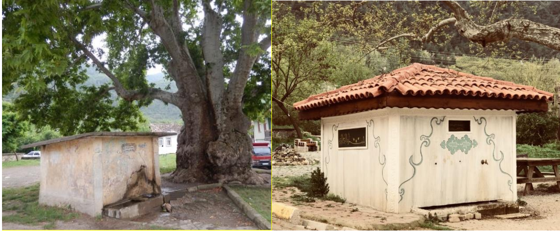
Şekil 9. Hüseyin Ağa Çeşmesinden bir görünüm (önceki ve restorasyon sonrası hali)

Taraklı merkezde bulunan çeşmenin yapım yılı üzerinde bulunan kitabede M. 1734-1735 yıllarında yapılmıştır. Osmanlı döneminden bugüne gelmiş tarihi çeşme kesme taştan olup kare planlıdır. Çeşmenin ana cephesinin iki köşesi de dışa doğru iki kare silme ile belirginleşmiştir. Onarım geçiren çeşme günümüzde hala kullanılmaktadır.