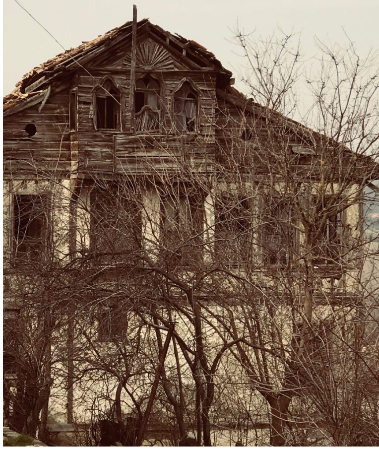
Şekil 15. Üçgen alınlıklı ev örneği

Üçgen ya da dikdörtgen planlı çıkmalar üzerinde iki ya da dört pencere bazılarında da üçgen alınlıklar yer alır.