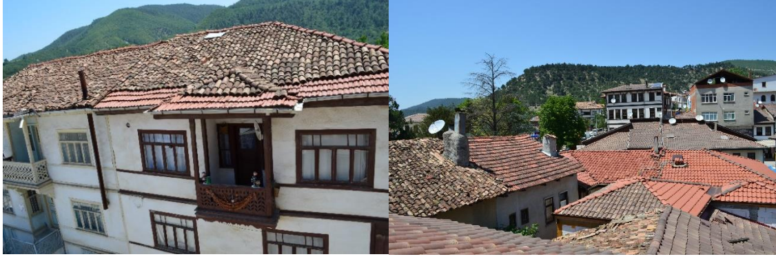
Şekil 16. Evlerin orijinal hali göz önünde bulundurulmadan yapılan yenilemeler.

Tarım ve hayvancılığın azalmasıyla daha önceden evlerin alt katları bu amaca hizmet ederken günümüzde bu mekanlar ya atıl konumdadır ya da işlevsel olması için mekan özellikleri değiştirilmiştir. Aynı zamanda bölge dışına verilen göçlerle genç nüfusun azalması ve geleneksel yaşam tarzının değişmesiyle konfor arayışının artması, yapı içerisinde özellikle ıslak hacimlerin yerlerinin değişimi ve eklentileri hem yapının içinde hem de dışında görünüm ve mekan bozulmalarına sebep olarak geleneksel yapının özgünlüğünü bozmuştur.