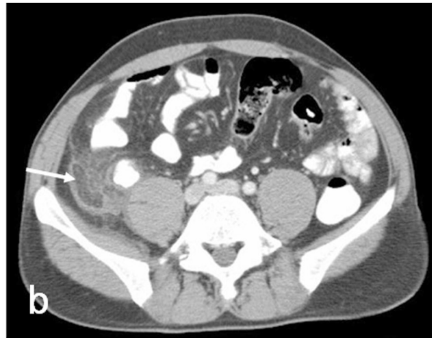
Resim 1. Çekum lokalizasyonunda santrali yağ dansitesine bağlı hipodens, periferi serozal enlamasyona bağlı yüksek dansitede periferik rim görünümü oluşturan epiploik apandisit lezyon (ok) izlenmektedir (a, b). Lezyon çevresinde yağlı planlarda kirlenme mevcuttur.