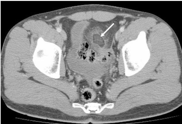
Resim 3. Sigmoid kolon lokalizasyonunda çevresindeki yağlı planları kirleten, santrali tromboze venlere bağlı daha hiperdens izlenen epiploik apandisit aittir lezyon (ok) izlenmektedir.

Bilgisayarlı tomografide hastaların tamamında perikolonik yerleşimli, santrali yağ dansitesinde hipodens lezyon ve periferinde seroza tabakasındaki inflamasyonunu temsil eden yüksek dansiteli periferik rim görünümü mevcuttu (Resim 1-3). Uzun aksı 2-4,5 cm, kısa aksları ise 1-2 cm arasında idi. Lokalizasyonları, 1 hastada çekumda (%10) 2 hastada çıkan kolonda (%20), 2 hastada inen kolonda (%20) ve 5 hastada sigmoid kolonda (%50) idi. Medikal tedavi sonrasında tüm hastalarda semptomlar 7 gün içinde tamamen kayboldu.