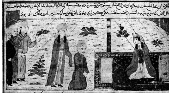
-Sultan Raziye'nin Minyatürü-