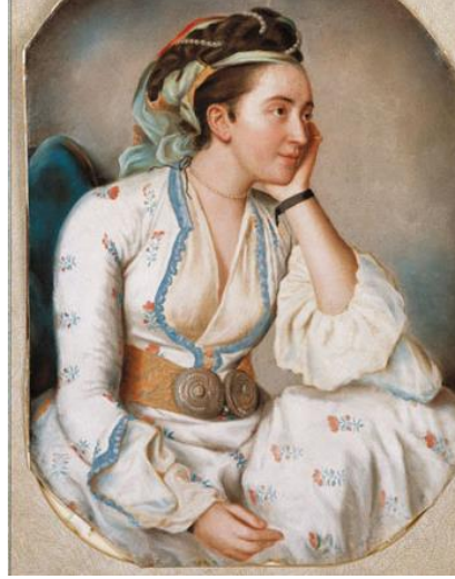
-Sultan Raziye'nin Temsili Resmi-