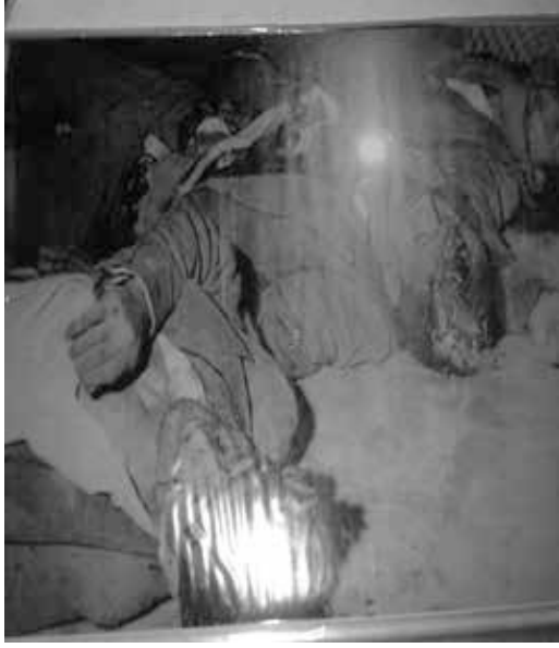
Foto 1: 21 Aralık 1963'te Rumlar Tarafından Gerçekleşen Kanlı Noel Baskını Doktor Nihat İlhan ve Üç Çocuğunun Evin Banyosunda Katledilmesi