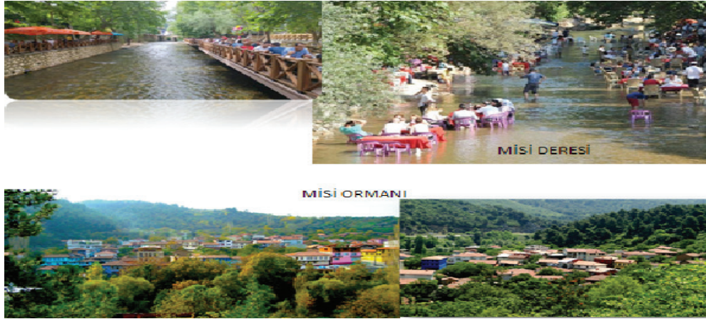
Şekil 3. Misi Köyü yürüyüş, bisiklet rotaları ve kamp alanı