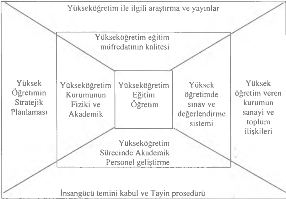
Şekil: 1-Yükseköğretim Kalitesini Etkileyen Kurumsal Faaliyetler

sağlanırsa kaliteli insangücü yetiştirebilir (Şekil: 1).