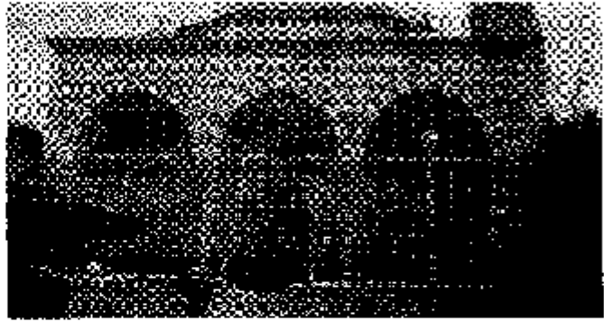
Resim 1: Caminin Dıştan Görünüşü