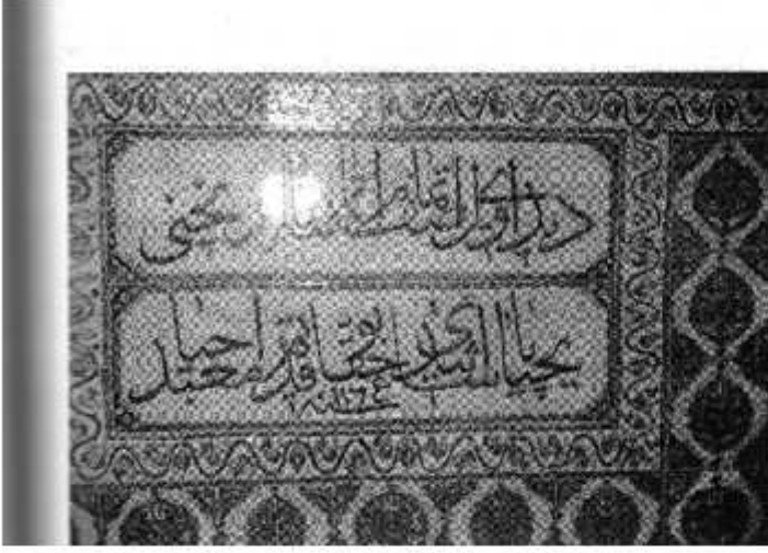
Resim 31: Yahya Paşa'nın Tamir Kitabesi