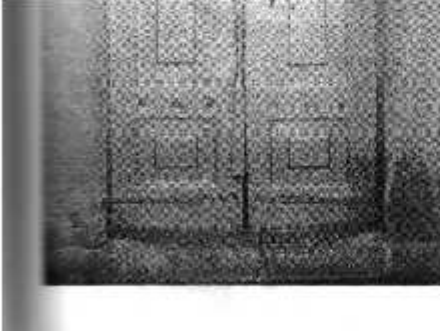
Resim 31: Camiinin Kapısının Görünüşü