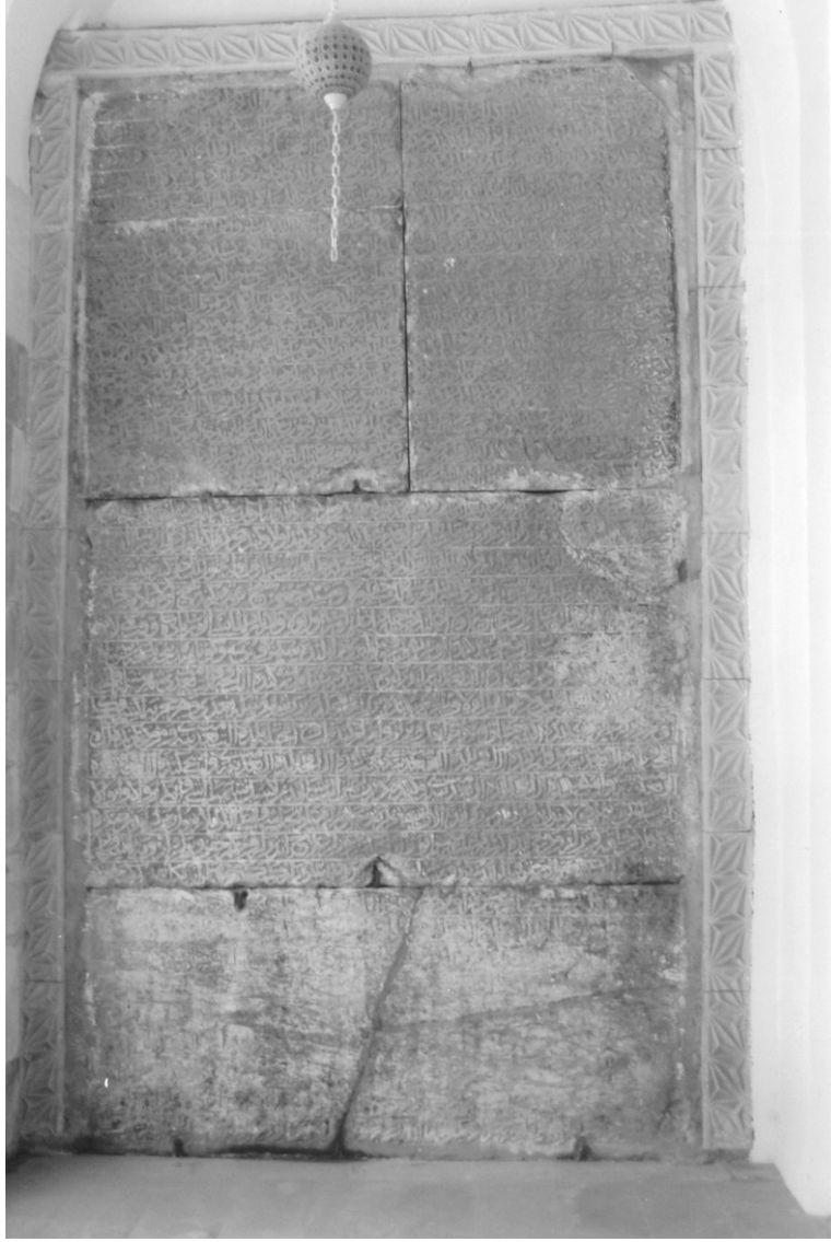
II. Yakub Bey'e Ait H. 817 Tarihli Taş Vakfiye (Kitâbe)