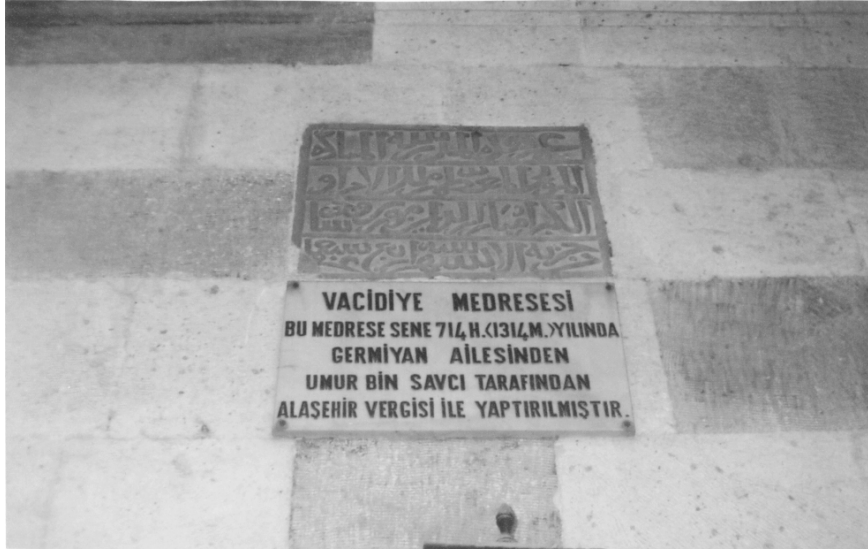
Vâcidiye Medresesi'nin Kitâbesi