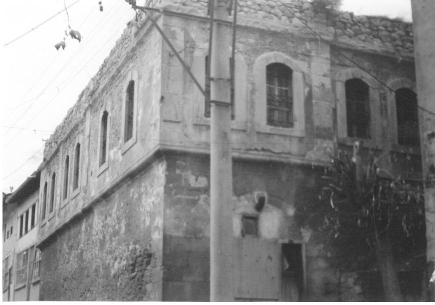
İshak Fakih Medresesi'nin Genel Görünümü