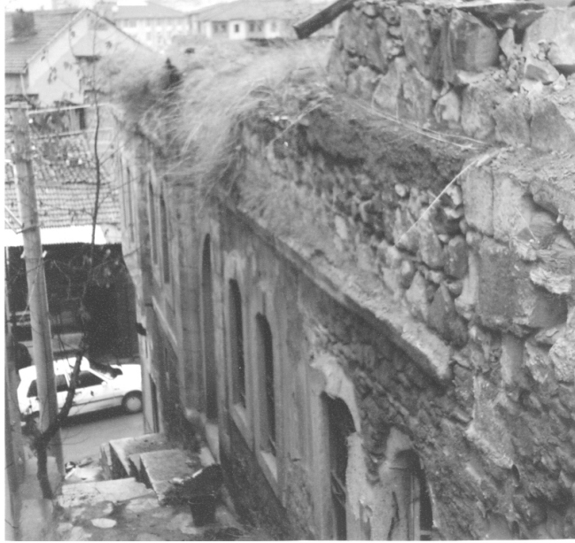
İshak Fakih Medresesi'nin Giriş Kısmı