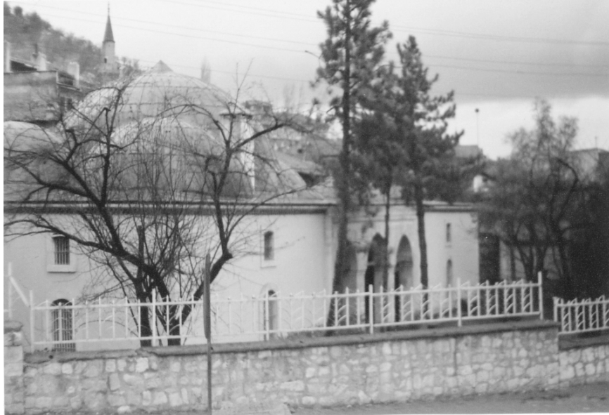
Germiyanoğlu Yakub Bey Külliyesi