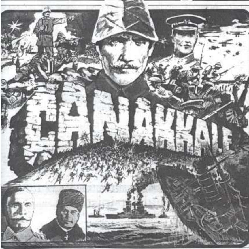
Tercüman gazetesinde Çanakkale savaşını resmeden bir çizim.