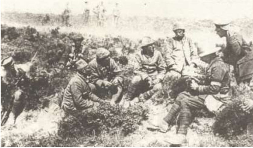
Çanakkale cephesinden İngilizler tarafından esir edilen Türk esirlerinin sorgulanması.