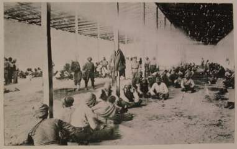
Toplu halde oturup birbirleriyle vakit geçiren esirler.