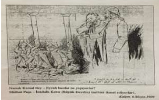
Koloğlu, "1908 Basın...", s..137.