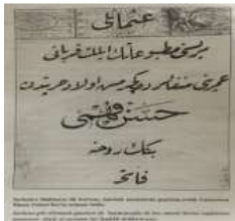
Koloğlu, "1908 Basın...", s.131.