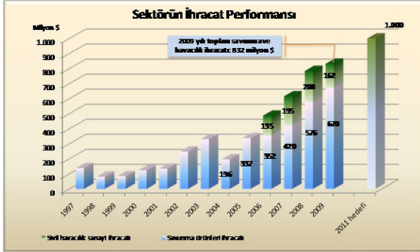
GRAFİK 1: Sektörün İhracat Performansı (milyon dolar)

Kaynak: Türkiye Savunma Sanayi Sektör Raporu 2009, Türkiye Odalar ve Borsalar Birliği (TOBB) Türkiye Savunma Sanayi Meclisi, Mayıs 2010.