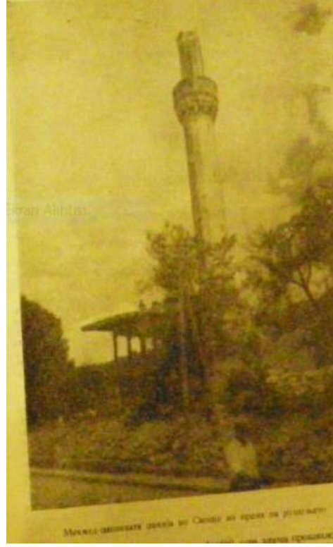
Kaçanikli Mehmed Paşa Vakfıyesi