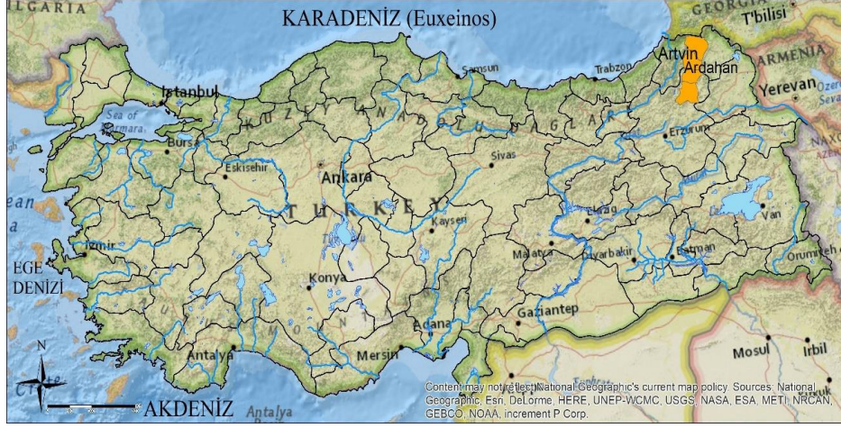
Harita 1: Çalışma sahasının Türkiye haritasındaki konumu