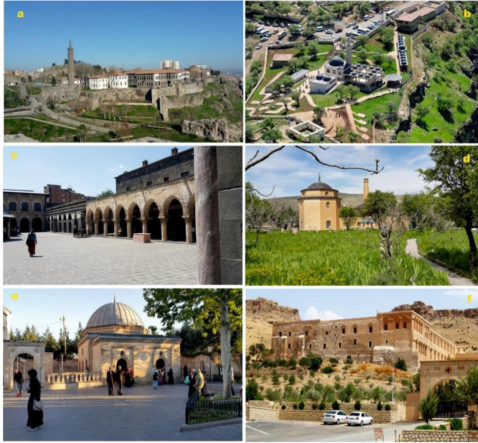
Fotoğraf 2: Güneydoğu Anadolu Bölgesi'nin bazı inanç turizmi alanları: a) Diyarbakır Suriçi Hz. Süleyman Cami, b) Eğil'de Elyessa ve Zülküfl peygamberlerinin kabirlerinin bulunduğu Ziyaret Tepesi, c) Diyarbakır Ulu Cami, d) Tillo'daki İsmail Fakirullah Türbesi ve Işık Kulesi, e) Baykan Ziyaret Hz. Uveys el Karani Türbesi, f) Mardin Deyr'ul Zaferan Manastırı.

minare mimarisinin başyapıtları arasında sayılan onlarca cami, Mardin ilini inanç turizmi açısından çok değerli bir konum haline getirmiş bulunmaktadır. Mardin-Diyarbakır karayolunun 14. km'sinden ayrılarak ulaşılan Şeyh Sultan Musa (Şeyhmuz) Külliyesi de çok önemli bir inanç turizmi merkezi olarak dikkati çeker. Bilhassa çocuk sahibi olamayanların bolca ziyaret ettiği bu mekânın yılda bir milyondan fazla ziyaretçisi bulunmaktadır (Bölgede kız çocukları arasında Sultan ve erkek çocukları arasında Şeyhmuz adlarının bolluğu bu yüzdendir). Bu külliye kaliteli bir otelin ( Şeyhsultan Oteli ) inşa edilmiş olması da ziyaretçi sayısını artıran faktörler arasındadır.