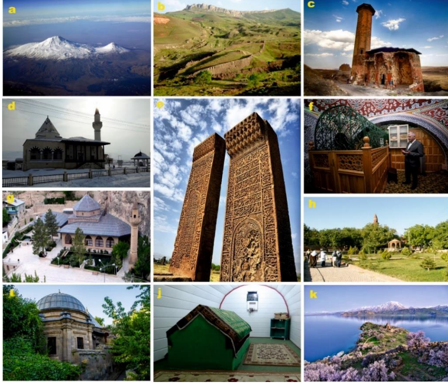
Fotoğraf 3: Doğu Anadolu Bölgesi'nin bazı inanç turizmi alanları: a) Ağrı Dağı, b) Doğubayazıt Telçeker-Üzengili köyleri arasında Nuh AS'ın gemisi olduğu ileri sürülen silüet, c) Ani'de bulunan Manuçehr Cami, d) Erzurum Alvar köyünde bulunan Şeyh Muhammed Lütfi Efe Türbesi, e) Ahlat Selçuklu Büyük Meydanlık Kabristanı'ndaki anıt mezar taşları, f) Erzurum Abdurrahman Gazi Türbesi iç mekanı, g) Darende Somuncu Baba Cami ve Türbesi, h) Ahlat Abdurrahman Gazi Cami ve Türbesi, i) Bitlis Şeyh Muhammed Küfrevi Türbesi, j) Bitlis Feyzullah el Ensari Türbesi, k) Van Gevaş Akdamar Kilisesi ve arka planda Artos Dağı.

evliyadır. Türkiye çapında tanınan bu şahsiyetin türbesi, bir cami içinde olup, çevresinde oluşturulan havuzlarda kutsallığına inanılan çok sayıda balık yaşamaktadır.