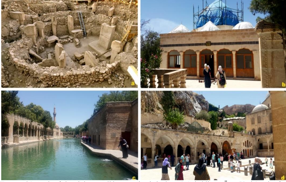
Fotoğraf 1: Şanlıurfa kentinin önemli inanç turizmi alanları: a) Göbeklitepe Ören Yeri (Şanlıurfa, Örencik Köyü), b) Viranşehir Eyüp Nebi Köyü, c) Halilürrahman Gölü (Balıklı Göl), d) Hz. İbrahim'in doğduğu mağara.