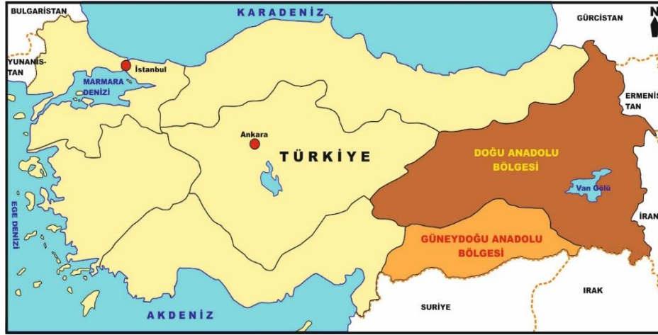
Şekil 1: Doğu ve Güneydoğu Anadolu Bölgelerinin Lokasyon Haritası.

İnceleme konusu edilen ikinci bölge olan Güneydoğu Anadolu ise alan bakımından Türkiye'nin en küçük bölgesidir (57171 km 2 , %7,3). Güneydoğu Toros Dağları ile Suriye sınırı arasında uzanan bu bölge, büyük kısmı 500-600 m. yükselti basamakları arasında uzanan, yüzeysel kıvrımlar ve volkan kütleleriyle az arızalanmış düzlükler sahası olarak tanımlanır. Bölge Fırat ve Dicle ırmaklarının arasında uzanan Mezopotamya alanının kuzey kısmını teşkil eder. Türkiye'nin uyguladığı büyük bir enerji ve sulama yatırımı projesi olan GAP sayesinde hızla kalkınmaya başlamış, nüfusu 2015 yılında 7900096'ya ulaşmıştır (Türkiye nüfusunun %10'u). Matematiksel nüfus yoğunluğu da ülke ortalamasının oldukça aşarak 138 kişi/km 2 'ye yükselmiştir. Bu bölge, Doğu Anadolu'ya benzer şekilde terör olaylarından etkilenmişse de entegre projelerin sağladığı refah ortamı, terörün minimize edilebilmesini kolaylaştırmıştır. Bölgede faaliyet gösteren 24 adet firmanın Türkiye'nin en büyük ilk 500 firması arasına girme başarısı göstermiş oluşu, bu durumu kanıtlar niteliktedir (Arınç, 2016).