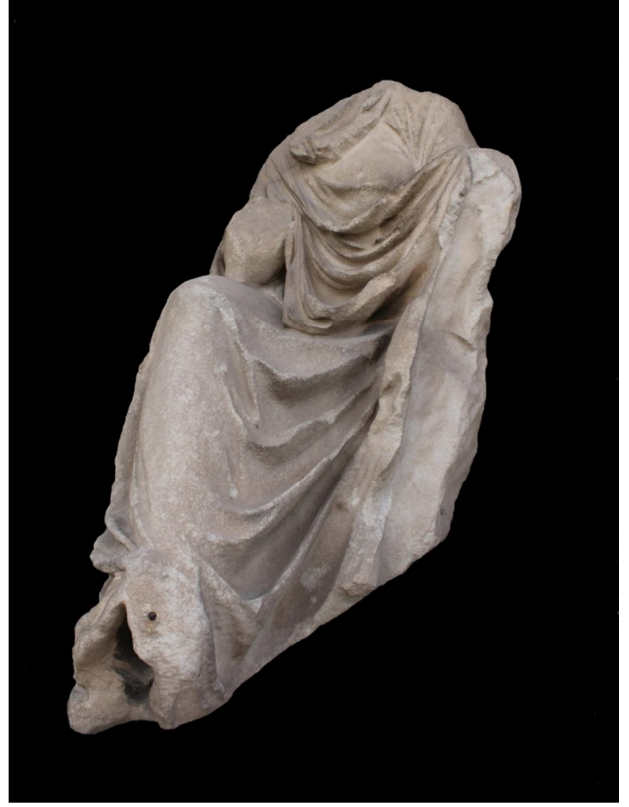
Res. 1 c