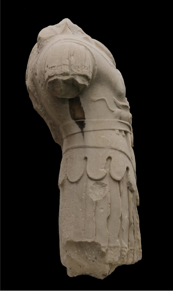
Res. 3 b