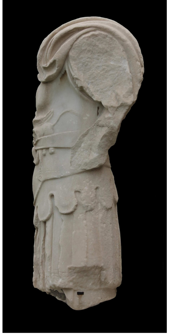
Res. 3 c