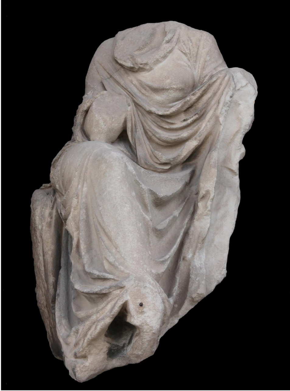
Res. 1 a