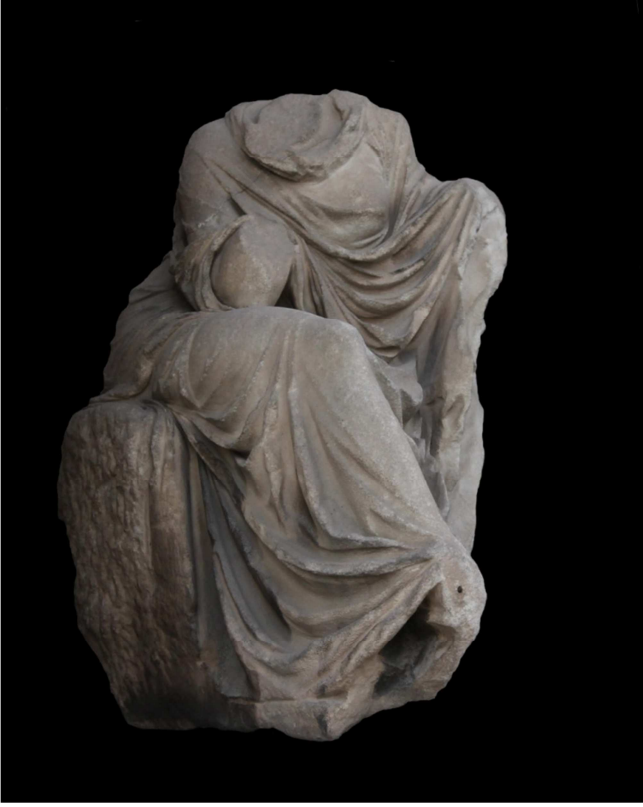
Res. 1 b