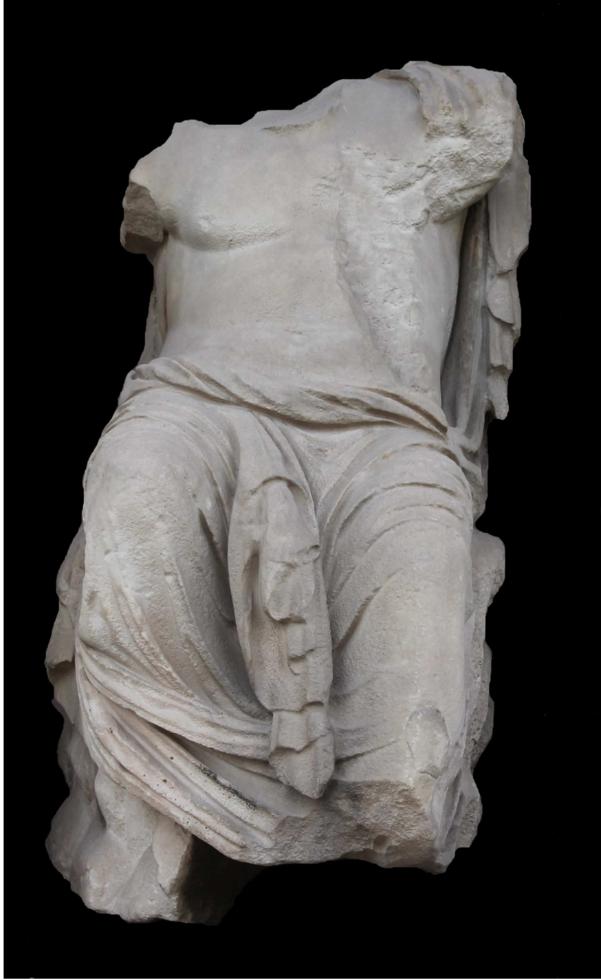
Res. 2 a