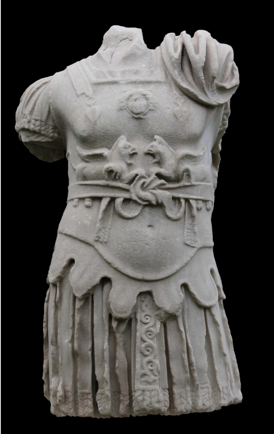
Res. 3 a