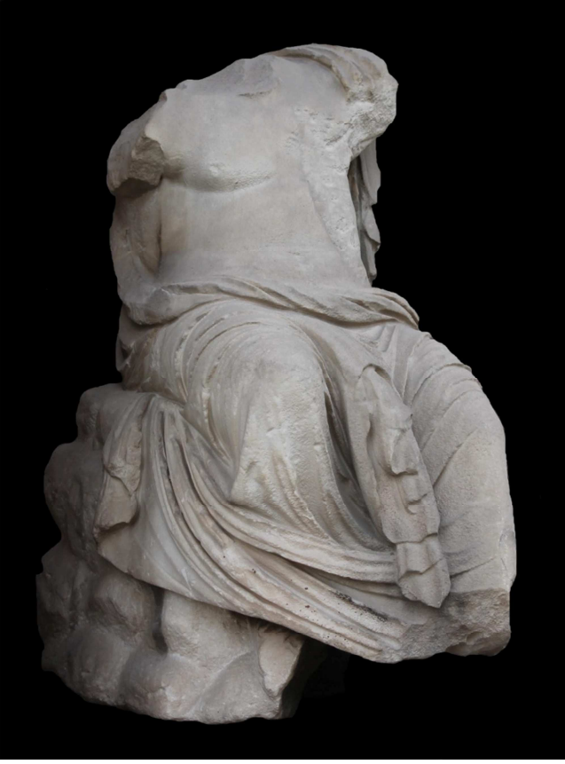
Res. 2 b