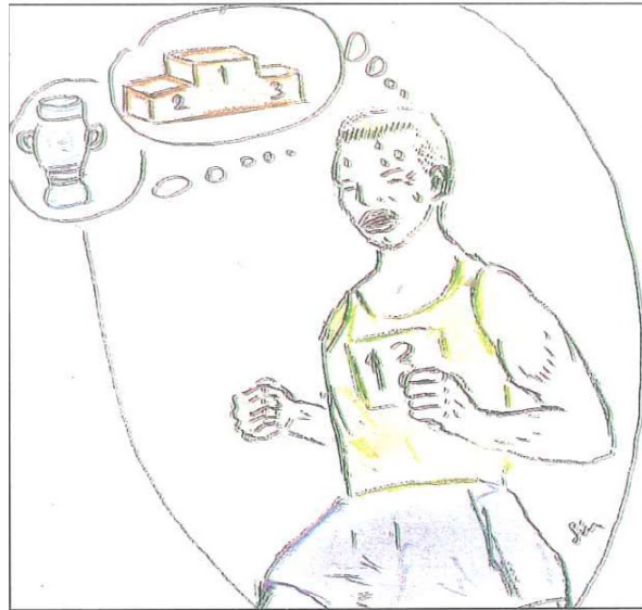
Çizim 3. Atletizm: Amatör sporların belkemiği! (Yazarın kendi çizimidir).

Spor üzerinden gayrı-amaçlar, yan-beklentiler sporun sâfiyetini zedeler ki bu durum okul sporları için dahi bir nebze hakikat hükmündedir demek yanlış olmaz! Okul takımında yer alınca zayıf derslerin kurulda başlanacağı umudu; eşofman, çanta, anorak gibi donanım edinme; sporu seyahatlere vesile kılma; artistik bir edâyla voleybol / basketbol oynarken kızlara caka satma gibi çocuksu ufak tefek yozlaşma ve bulaşmalar dahi mevcuttur elbette.