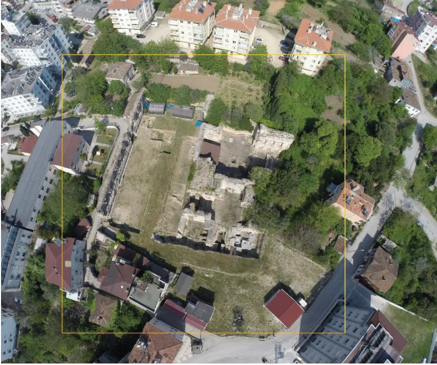
Fot. 1: Sinop Balatlar Yapılar Topluluğu kazı alanı.

Müslüman olmayan mahallelerin isimleri verilmiştir. Balatlar Mahallesi 15-16. yüzyıllarda Müslüman mahalleler arasında yer alırken, 18. yüzyıl şer'iyye sicillerinde, Müslüman olmayan mahalleler içerisinde sayılır. 2 Mehmet Öz'ün aktarımıyla; 15-16. yüzyıllarda Balatlar Mahallesi'nin, Müslüman ve Müslüman olmayanların birlikte yaşadığı bir yer olduğunu öğreniyoruz. 3 Ancak, farklı dinlere sahip halkların, mahalle bazında ne kadar iç içe yaşadığı sorusu tartışmalıdır. Bu nedenle, 200-300 yıllık bir süreci kapsayan genel bilgilerin yanıltıcı olabileceği görüşündeyiz. Mahallelerde demografik yapının zaman içerisinde göçler nedeniyle değişebildiği de bilinmektedir. Ancak Balatlar Yapı Topluluğu'nun kronolojik geçmişine bakıldığında, mahallenin demografik yapısının aslında çok fazla değişmediği, özelde Rum topluluğunun yaşadığı bir alan olduğu dikkat çekmektedir.