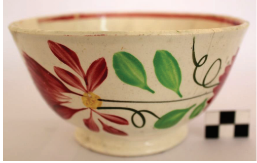
Fot. 7: İngiltere'den ithal Scottish Spongware olarak adlandırılan ve Staffordshire üretimi olduğunu düşündüğümüz seramiklerden. (Kazı Arşivi)

2017 yılında gerçekleştirilen kazılarda, yapı topluluğunun X no.'lu mekanında (b9-b8 açmalarında) bulunan, Opaque de Sarreguemes damgalı çukur tabağın iç yüzünde Osmanlıca olarak " Buyurunuz efendim... " iyi dilekleri yazar. 36 (Fot. 9) 19. yüzyılda Avrupa'da, Osmanlı piyasasına hitap eden seramikler üretilmiştir. 37 Bu tabak