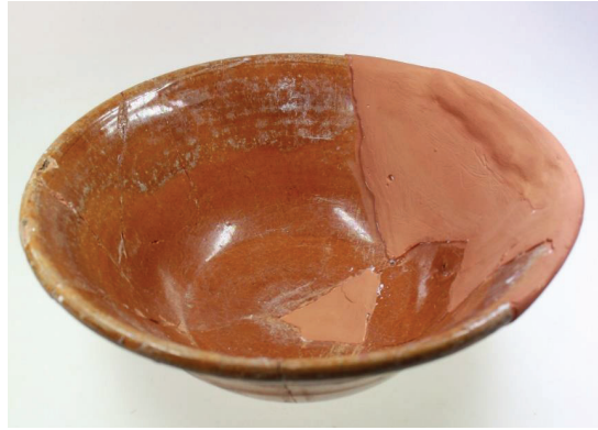
Fot. 10: Taches Noires (siyah lekeli) seramiklerden.