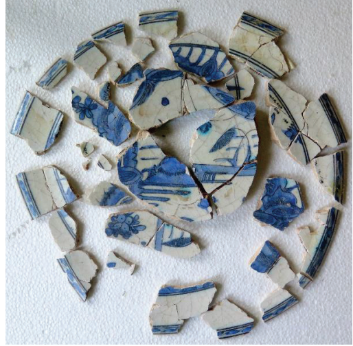
Fot. 2: Safevi Dönemi seramiği.

Balatlar Yapı Topluluğu kazılarında yoğun bir şekilde ortaya çıkarılan ve Avrupa’nın çeşitli ülkelerinden gelen seramikleri yalnızca malzeme özellikleri açısından değil, Sinop’un tarihsel süreci içerisindeki yeri açısından da inceledik. Bizi bu konuya iten sebep ise tarihsel süreçteki boşluklar