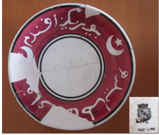
Fot. 9: Sarreguemines üretimi tabak.

Arkeolojik veriler ışığında buluntuları tekrar gözden geçirdiğimizde; Balatlar Yapı Topluluğu kazılarında, İngiltere ve Fransa üretimi seramiklerin varlığı dikkat çekmektedir. Yukarıda da değindiğimiz gibi, özellikle 17. yüzyılın başlarından itibaren Osmanlı topraklarında İngiliz, Fransız ve Hollandalıların etkili olmaya başladığını görüyoruz. Bu etkiler elbette hem siyasi hem de ticari faaliyetler olarak kendini göstermiştir. Bu ilişkilerin bir getirisi olan ithal malların varlığı da tarihsel verileri desteklemektedir. Balatlar Yapı Topluluğu kazılarında ortaya çıkarılan İngiliz ve Fransız seramikleri, özellikle