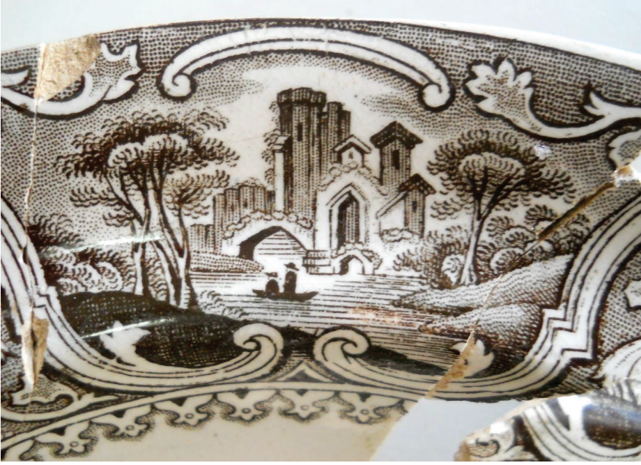
Fot. 6: Doğa, anıtsal yapılar ve gondolla gezinti yapanların birlikte tasvir edildiği manzara betimlemeleri. Transfer (serigrafî) baskı teknikli tabak örneğinden ayrıntı. (S. Gök)

1830 yılları arasında da “FELL” imzasını kullanmıştır. Bir diğer örnekte ise W.L.L. imzası yer almaktadır. Bu marka da William Lowe , Sydney Works, Longton, Staffordshire seramiklerine aittir ve bu fabrika 1874-1930 arasında üretim yapmıştır. 31 Benzer örnekler ve markalar Smyrna (İzmir) Agorası buluntuları içerisinde de tespit edilmiştir. 32