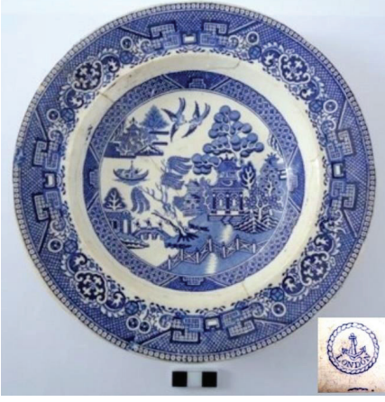
▲ Fot. 4-5: “Çin Söğüdü” hikâyeli, transfer (serigrafi) baskılı tabaklar.