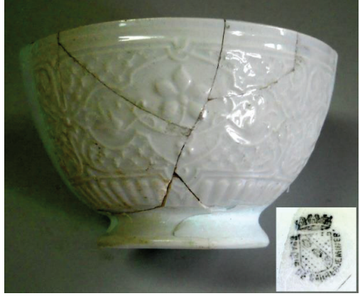
Fot. 8: Sarreguemes üretimi kase.