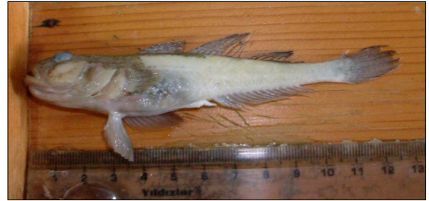
Şekil 10. Tatlı su kaya balığı Neogobius fluviatilis (Pallas, 1814)

Araştırmadan elde edilen bulgulara göre tatlı su kaya balığı Neogobius fluviatilis (Pallas, 1814) (Şekil 10) meristik karakterleri; D1 = VI, D2 = I 16-17, V = I 5, A = I 14-15, P = 18, L.lat. = 59-61, SD = 5-6 ve N =14'tür.