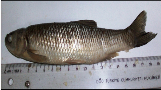
Şekil 8. Tatlı su kefali Squalius cephalus (Linnaeus, 1758)

Araştırmada incelenen tatlı su kefalinin Squalius cephalus (Linnaeus, 1758) (Şekil 8) meristik karakterleri; D = II-III 8-9, V = II 8, A = III 8, P = I 16, L. Lat. = 44-46, L. Tran. = 8/3-4, FD = 2.5-5.2, SD =8 ve N =10'dur.