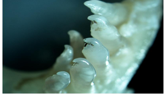
Şekil 9. Tatlı su kefali farinks dişleri

Tatlı su kefalinin metrik karakterleri ise; SB/VY = 4,10-4,60, SB/BB = 3,80-4,30, BB/GÇ = 3,35-4,50, BB/İM = 2,05-2,90, İM/GÇ = 1,03-1,97'dir. Farinks dişlerinin dizilişi 2.5-5.2 şeklindedir (Şekil 9).