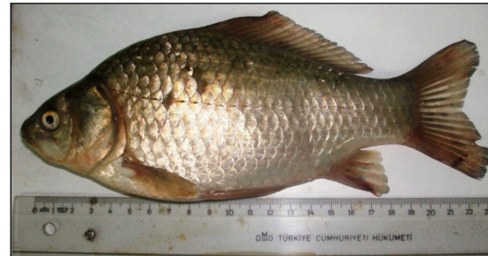
Şekil 6. İsrail sazanı Carassius gibelio (Bloch, 1782)

Araştırma bölgesinden yakalanan İsrail sazanı Carassius gibelio (Bloch, 1782) (Şekil 6) meristik karakterleri; D = III-IV 18-21, V = II 7-9, A = II III 5-6, P = I 15-20, L. Lat. = 29-31, L. Tran. = 6-7/6, FD = 4-4, SD = 50-60 ve N =47'dir.