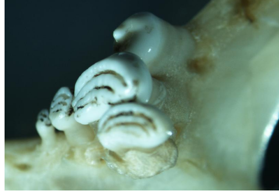
Şekil 5. Pullu sazan farinks dişleri

Pullu sazanın metrik karakterleri; SB = 56-305, SB/VY = 2,60-3,60, SB/BB = 2,80-3,90, BB/GÇ = 4,13-7,13, BB/İM = 1,70-3,00, İM/GÇ = 1,66-3,82, PBU/ABU = 1,59-4,38'dir. Farinks dişlerinin dizilişi ise 3.1.1-1.1.3 şeklindedir (Şekil 5).