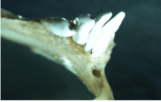
Şekil 7. İsrail sazani farinks dişleri

\dot{I}M/G\dot{C} = 1,68-3,15 'tir. Farinks dişlerinin dizilişi 4-4 şeklindedir (Şekil 7).