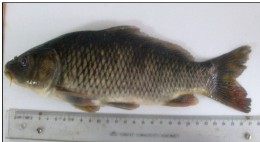
Şekil 4. Pullu sazan Cyprinus carpio (Linnaeus, 1758)

3.1.1. Pullu Sazan Cyprinus carpio Linnaeus, 1758 Araştırma bölgesinden yakalanan pullu sazanın (Şekil 4) meristik karakterleri; D = III 20-21, V = I-II 8, A = II-III 5-6, P = I 14-16, L. Lat. = 35-37, L. Tran. = 5-7/6, FD = 1.1.3-3.1.1, SD = 28-29 ve N =80 olarak belirlenmiştir.