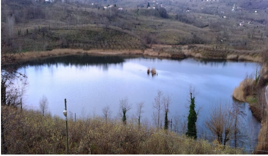
Şekil 2. Gaga Gölü'nden bir görünüm

Gaga Gölü, 40°58.407'N-37°30.262'E koordinatında, 67 m rakımda, 69320 m 2 büyüklüğünde, ortalama derinliği 15 metre, çanağının boyutu 200x250 m olan küçük bir göldür (Şekil 2).