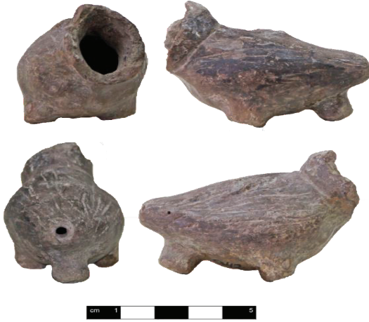
Resim 3: Suluca Karahöyük Kuş Ritonu