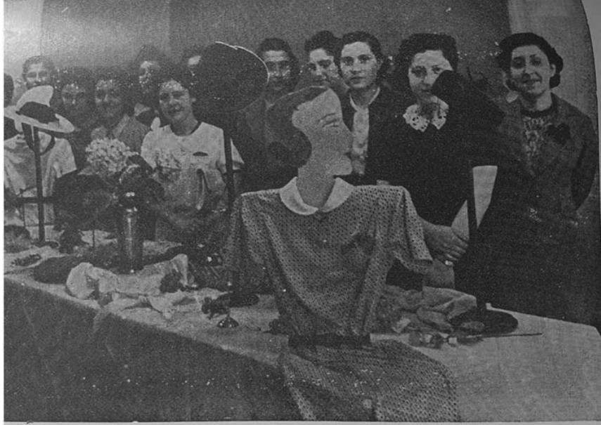
Halkevlerinde Kurslar : Biçki-Dikiş, Çiçekçilik, Şapkacılık Kurslarından ve Kurslara ait sergilerden bir görünüş

Fotoğraf 3. SINGER'in Halkevleri'nde ücretsiz açtığı biçki-dikiş, çiçekçilik, şapkacılık kurslarına ait bir fotoğraf (CHP, 1941: 67).