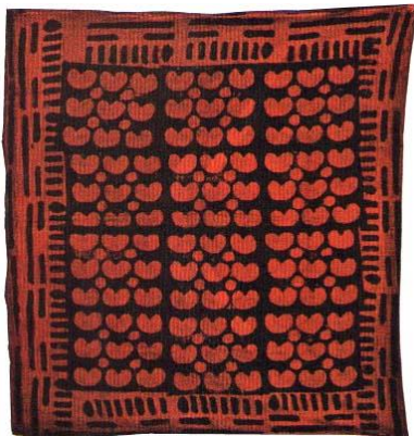
Resim 2: Göbek motifi (Türker, 1996:22)