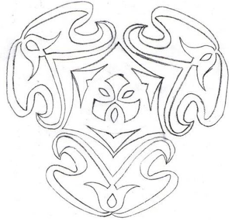
Resim 6: Desenin aydıngerde oluşturulması ve son halini alması