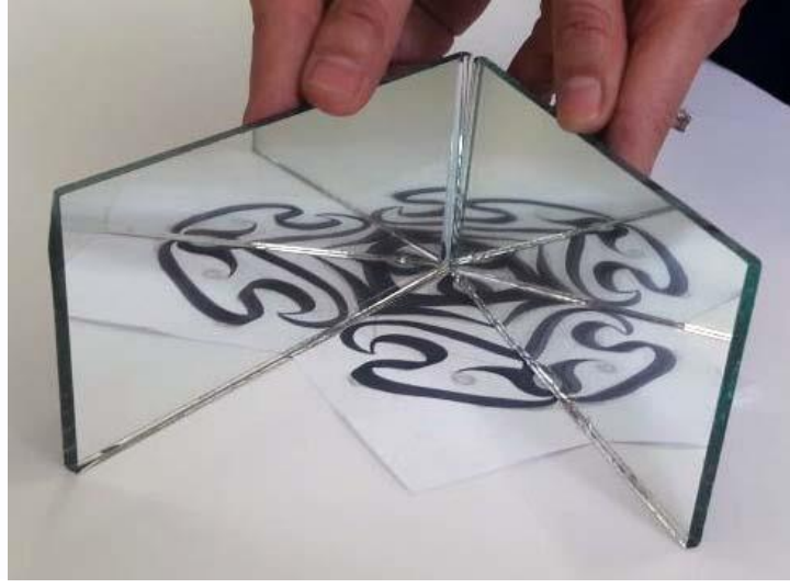
Resim 5: Karalama çalışmasının düzenlenmesi ve ayna ile kontrolü

Seçilen üçgen parça parşömen kağıdına veya aydıngere yan yana kopyalanarak tam bir daire oluşturulur. Böylece özgün desen tamamlanmış olur. Desen boyutlarından tercihe göre bir kaç santimetre büyüklüğünde ve 5-6 santimetre kalınlığında ağaç parçalarından yazma kalıpları hazırlanabilir. Tamamlanan desen tercihen ıhlamur ağacından kesilmiş düzgün bir parçaya kopyalanarak oyma işlemi gerçekleştirilir. Oyularak hazırlanan yazma kalıpları ile istenilen kompozisyonda baskılar yapılabilmektedir. Ayrıca daha pratik bir kalıp hazırlama yöntemi olan straför ile de yazma kalıpları hazırlanabilir.