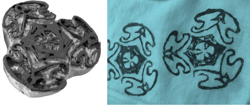
Resim 7: Kalıbın hazırlanması (Akbulut, 2016:418) ve kumaşa uygulanması