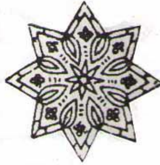
Resim 1: Dairesel planda gelişen yazma kompozisyonu (Türker, 1996:21)