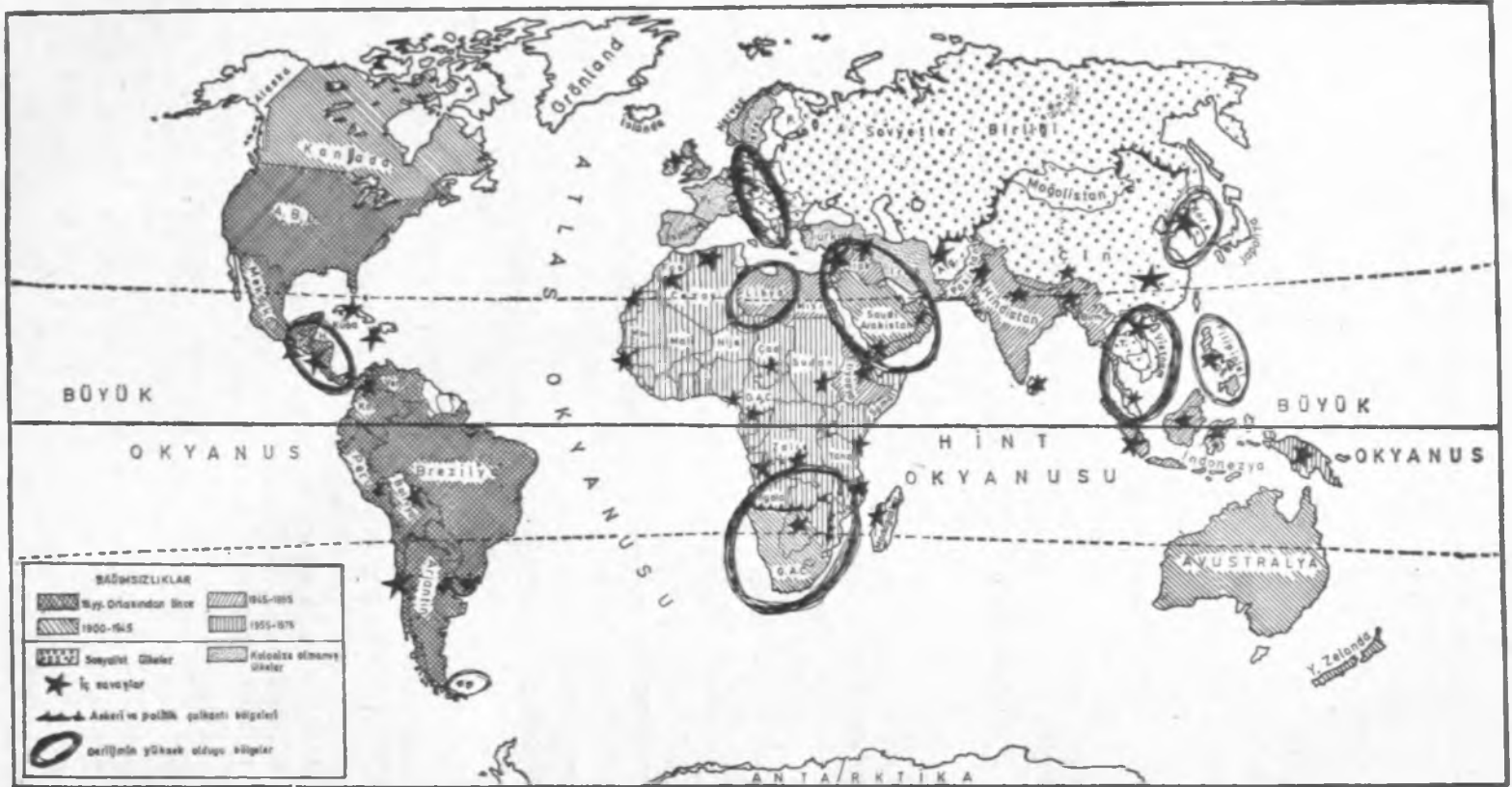
Şekil : 3 JEOPOLİTİK - JEOSTRATEJİK ÖNEMİ YÜKSEK ÜLKE VE BÖLGELER