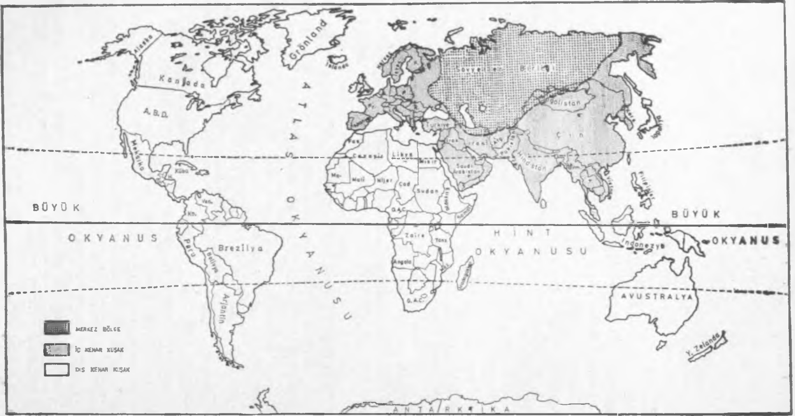
Şekil : 1 MERKEZ BÖLGE VE KENAR KUŞAK TEORİLERİ