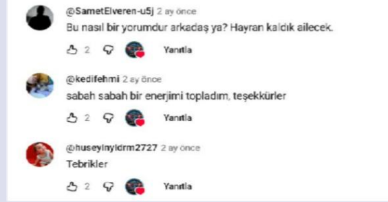
Picture 3. Comments on the modified form of lament Resim 3. Değiştirilmiş ağıt türüne yapılan yorumlar

Kaçırılan sözlüsü, bir süre sonra serbest bırakılsa da Halil’e kavuşamadı. Ağıt, Halil ve Hediye’nin karşılıklı konuşmasından oluşuyor.”( https://www.trtavaz.com.tr/haber/tur/turkistandan/onbesli-iler-cepheye-kostu-iste-onlarin-ve-turkulerinin-hikayesi/6415739501a30a0c9853af77 ). Bilindiği üzere ağıtlarda söylem ağırlıklı ve ezgisi yavaştır ama burada rock versiyona çevrilmiş olan bu ağıt, binlerce tıklanma almış ve Youtube’ya yeni yüklenmiş olmasına rağmen birçok beğeni almıştır. İnsanların bu tarz parçalara, yorumları da normal bir ağıta yapılacak yorumlardan farklıdır. Aşağıdaki yorumlar ise bu müziğe gelen yorumlardan sadece birkaçıdır.