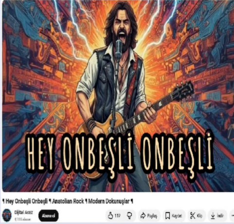
Picture 2. An example of a lament that evolved into the rock genre.

Yapay zekanın hayatımıza girmesiyle, sadece bilgi anlamında değil aynı zamanda görsel ve video olarak da işler farklı bir boyut almıştır. Yani çok eski dönemlerden beri süregelen değişimler var olsa da yapay zeka ve dijitalin gelişimi ile süreçteki değişim ve yayılım hızını artırmıştır. Sadece birkaç tık ile kişilerin belki de hayatlarında görmemiş oldukları enstrümanları bir parçaya koymaları ve onu bambaşka bir hale getirip, ilk söyleniş biçimlerinden de farklı duyguları açığa çıkarttıkları görülebilir. Bunun örneği çok olmakla beraber, moderniteye ayak uydurmuş olarak düşünüldüğünde bir yanlış görülmemektedir. Çünkü insanlar normal bir vakitte açıp bir ağıt dinlemezken, rock müzik versiyonu yapılan bir ağıt; arabada, evde, yolda yürürken ve günün her anında dinleyebilirler. Burada değişen ezgiler ve söyleniş tarzıdır ama sözler hep aynıdır. Zaten verilmek istenen burada sözlü mesajlardır. Bundan dolayı da mesajın kaybolmamasının yanı sıra, modern bir tarza evrildiği için varlığını hep korumuştur. Resim 2’de de görüldüğü üzere yakın bir tarihte yüklenen bir içerik çokça beğeni almasının yanı sıra binlerce tıklanmıştır. Bu da güncelliğini koruduğunu göstermektedir. Aşağıdaki ağıt, 15 yaşındaki gençlerin belki de dönüşü olmayan bir yola gittikleri için yakılan bir ağıttır ama günümüzde bu ağıt düşünlerde, eğlence mekanlarında farklı bir versiyon ile duyulabilmektedir.