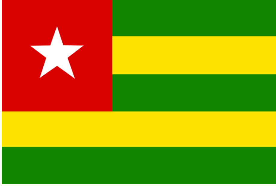
Resim 2: 27 Nisan 1960 Tarihinde Kurulan Togo Cumhuriyeti'nin Bayrağı