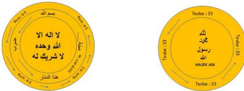
Şekil 3: Halife Me‘mûn Döneminden itibaren Abbâsî Dinarı Temel Yazı Kompozisyonu (Aydoğdu, 2018).

İlerleyen yıllardaki gümüş dirhemlerde de yine ikinci yazı kuşağının yer aldığı örnekler bulunduğu gibi tek yazı kuşaklı sikke örnekleri de mevcuttur.