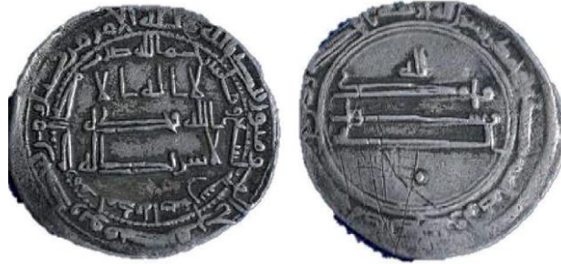
Fotoğraf 11: Me'mun Dönemi H. 209 (M. 824/25) tarihli ve Medineti Isbahan (İsfahan) baskılı dirhem örneği (Aydoğdu, 2015).

Ancak çift yazı kuşağı ihtiva eden örneklerin yanı sıra hala tek yazı kuşaklı örneklerin mevcudiyeti de günümüze gelen örneklerden bilinmektedir. (Fotoğraf 12)