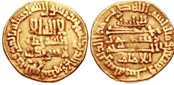
Fotoğraf 9: Halife Emîn Dönemine ait H. 196 (M. 811/12) tarihli dinar örneği. 22

b. İlerleyen Yıllardaki Abbâsî Sikkeleri (H. 198/M. 813 - H. 656/M. 1258 Halife Me‘mûn döneminden itibaren Abbâsî Döneminin sonuna kadar)