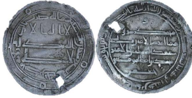
Fotoğraf 6: Halife Hârûnürreşîd Dönemine ait H. 179 (M. 795/96) tarihli dirhem örneği (Aydoğdu, 2015). بِسْمِ اللَّهِ ضَرَبَ بِالرِّيِّ فِي وِلَايَةِ مُحَمَّدِيَّةِ رِي سَنَةَ تِسْعٍ وَ سَبْعِينَ وَ مِئَةَ Bismi'llah duribe bi'l-Rey fi Vilâyet-i Muhammediye Rey sene tis'a ve seb'in ve mi'e.

Üzerinde isim zikredilen örneklerin dışında sadece محمد رسول الله ifadesiyle yetinilmiş örnekler de mevcuttur (Fotoğraf 7).