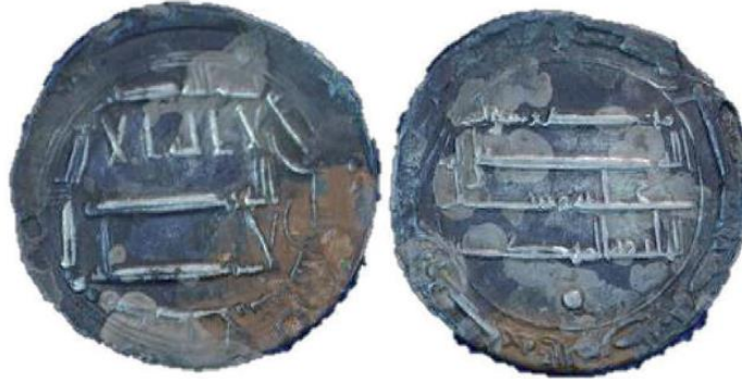
Fotoğraf 4: Halife Mehdî Dönemine ait H. 162 (M. 778/79) tarihli dirhem örneği (Aydoğdu, 2015). بِسْمِ اللَّهِ ضَرَبَ هَذَا الدِّرْهَمَ بِمَدِينَةِ السَّلَامِ سَنَةَ اثْنَتَيْنِ وَ سِتِّينَ وَمِئَةَ Bismi'llah duribe haza'd-dirhem biMedînetü's-Selâm sene isneteyn ve sittin ve mi'e.

Sikkeler üzerinde halife isminin ilk kez görülmesi, Halife Mehdî'nin "dirhem"lerinden itibaren başlamaktadır. Halife, arka yüzde adını الخليفة المهدي / El-Halîfet'ül-Mehdî şeklinde ünvanıyla birlikte vermiştir. Bunun altındaki nokta da yine ilk olup dikkat çekicidir 12 (Fotoğraf 4). Bununla ilgili olarak, "Mehdî Muhammed b. Ca'fer o yıl içerisinde (H.158), üzerinde noktalar bulunan yuvarlak sikkeler bastırmıştır", denilmektedir. 13