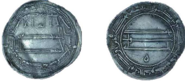
Fotoğraf 7: Halife Hârûnürreşîd Dönemine ait H. 189 (M. 804/05) tarihli dirhem örneği (Aydoğdu, 2015). بِسْمِ اللَّهِ ضَرَبَ هَذَا الدَّرْهَمَ بِالْمُحَمَّدِيَّةِ سَنَةَ تِسْعٍ وَ ثَمَانِينَ وَ مِئَةَ Bismi'llah duribe hâzad-dirhem bi'l-Muhammediye sene tis'a ve semenîn ve mi'e.

Üzerinde isim zikredilen örneklerin dışında sadece محمد رسول الله ifadesiyle yetinilmiş örnekler de mevcuttur (Fotoğraf 7).