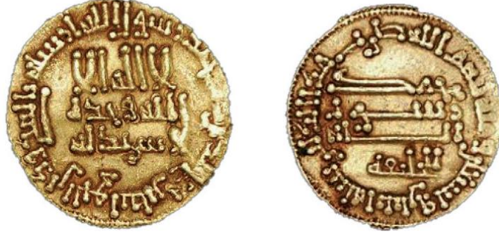
Fotoğraf 5: Halife Hârûnürreşîd Dönemine ait H. 192 (M. 807/08) tarihli dinar örneği (Aydoğdu, 2015). بِسْمِ اللَّهِ الرَّحْمَنِ الرَّحِيمِ بسم الله ضرب هذا الدينار سنة اثننتين و تسعين و مائة Bismillâh duribe haze'd-dinar sene isneteyn ve tis'in ve mi'e.

durumun, dönemin ekonomisinin ulaştığı seviye ile yakından ilişkili olduğu açıktır. Örneklerde halifenin adı verilmemiştir. Ancak arka yüzde الخليفة / el-Halîfe (ya da l'il-halife) ifadesi bulunanların (Fotoğraf 5) yanısıra, kimi örneklerde çeşitli isimlerin varlığı dikkati çekmektedir. Bunlardan en yaygın olanı Ca'fer olup, Ali, Musa, İbrahim, Ömer diğer isimlerdir. 14