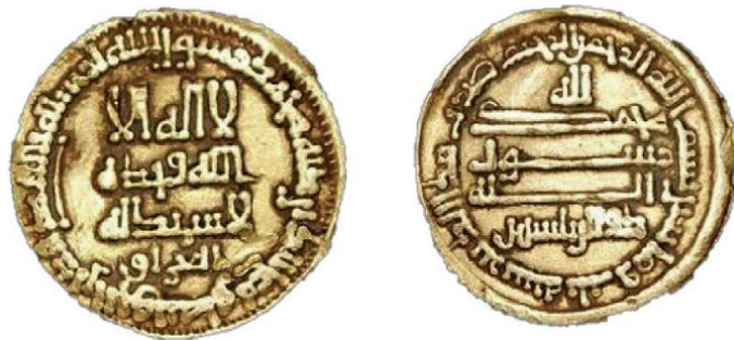
Fotoğraf 12: Halife Me'mûn Dönemine ait Irak baskılı ve H.203 (M. 818/19) tarihli dinar örneği (Aydoğdu, 2015). بسم الله الرحمن الرحيم ضرب هذا الدنار سنة ثلث و مائتين : Bismillâh'i-rrahmân'i-rrahîm duribe haze'd-dinar sene selase ve mieteyn.

Yine Halife Me'mûn dönemiyle birlikte sikkelerde gerçekleşen bir diğer yenilik ise, altın dinarlarda darphane isminin verilmeye başlanmasıdır. (Fotoğraf 12'de ön yüz yatay yazı sıralarının alt kısmında "İrak" basım yeri olarak verilmiştir).