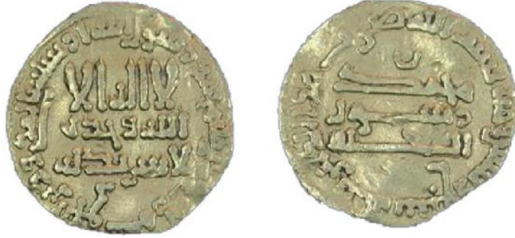
Fotoğraf 3: Halife Mehdî Dönemine ait H. 167 (M. 783/84) tarihli dinar örneği. بِسْمِ اللَّهِ ضَرَبَ هَذَا الدِّينَارَ سَنَةَ سَبْعٍ وَ سِتِّينَ وَمِئَةَ Bismi'llah duribe haza'd-dinar sene seb'a ve sittin ve mi'e.

Halife Mehdî Dönemi (H. 158/M. 775 - H. 170/M. 785) dinarlarında yine halife adı verilmeyerek daha önceki sikkelerde olduğu gibi Muhammed Rasûl Allah ifadesiyle yetinilmiştir. (Fotoğraf 3)