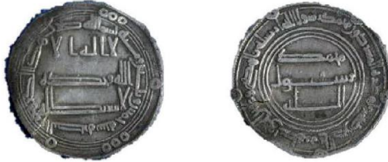
Fotoğraf 2: Ebu'l-Abbas es-Seffâh Dönemine ait H. 135 (M. 752/53) tarihli ve Basra baskılı dirhem örneği (Aydoğdu, 2015). بسم الله ضرب هذا الدرهم بالبصرة سنة خمس و ثلاثين و مئة. Bismi'llah duribe haza'd-dirhem bi'l-Basra sene hamse ve selâsîn ve mi'e.

Gümüş sikkelerde ise basım tarihiyle birlikte buna ilaveten basım yerinin de verilmesi önemlidir. (Fotoğraf 2)