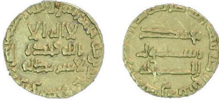
Fotoğraf 1 : Ebu'l-Abbas es-Seffâh Dönemine ait H. 135 (M. 752/53) tarihli dinar örneği (Aydoğdu, 2015). بسم الله ضرب هذا الدينار سنة خمس و ثلاثين و مئة. Bismi'llah duribe haza'd-dinar sene hamse ve selâsîn ve mi'e.

Gümüş sikkelerde ise basım tarihiyle birlikte buna ilaveten basım yerinin de verilmesi önemlidir. (Fotoğraf 2)