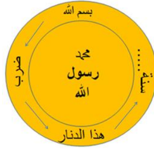
Şekil 1: Erken Dönem Abbâsî Dinarı Temel Yazı Kompozisyonu (Aydoğdu, 2018).

Gümüş sikkelerde, yazı ve geometrik formlarla oluşturulmuş kompozisyonlar dikkati çekmektedir. Gümüş sikkelerde yer alan yazı kalıpları, Abbâsî Döneminin başlarından sonuna kadar kimi farklılık ve çeşitlilikler sergilemektedir. Erken dönemlerde ön yüzde üç satır halinde “Lâ ilâhe illâ Allah Vahdehu Lâ şerîke leh / لا اله الا الله وحده لا شريك له” ibaresi yer alırken, sikkenin etrafını dolanan yazı kuşağında ise, “Bismillah duribe haza'd-dirhem bi... sene... / ---سنة--- بسم الله ضرب هذا الدرهم ب--- سنة---” kalıbı ile sikkenin basım yeri ve tarihine ilişkin bilgiler verilmektedir. Ancak halife adına rastlanmamaktadır. Yazı kuşağı üç sıra yuvarlak silme ile çerçevelenmiştir. Dıştaki silme üzerinde, aralarda bazen üç, bazen iki veya birer minik dairelerin yerleştirilmesiyle süsleme oluşturulmuştur. Arka yüzlerde ise, “Muhammed Rasûl Allah” ibaresi yer alırken, sikkenin etrafını dolanan yazı kuşağında Tevbe suresi 33. ayet yer almaktadır. Sikkelerin arka yüzlerinde ortadaki yatay yazılar yuvarlak çerçeve içerisine alınmış ve yazı kuşağından sonra sikke yine dairevi bordürle nihayetlendirilmiştir. (Şekil 2)