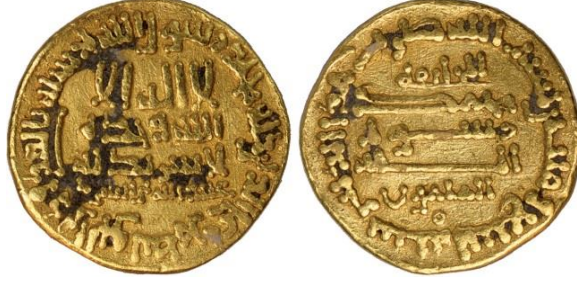
Fotoğraf 13: Halife Me'mûn Dönemine ait H. 209 tarihli dinar örneği. 27

Dinarlar üzerinde halife adı yerine vezir adı yine görülmektedir. Fotoğraf 12'deki dinar örneğinin arka yüzünün alt satırında “zü'r-Riyâseteyn / ذو الرياستين”, Halife Me'mûn'un veziri Fazl/Fadl b. Sehl'in bizzat halife tarafından verilmiş ünvanıdır. 25 Anlaşılan o ki, geniş yetkileri elinde bulunduran Fazl b. Sehl, aldığı bu ünvanı dönemin dinarları üzerinde duyurmuştur. 26