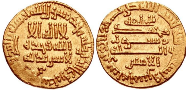
Fotoğraf 8: Halife Emîn Dönemine ait H. 195 (M. 810/1) tarihli dinar örneği. 21

Halife Emîn Döneminde (H. 193/M. 809 -H. 198/M. 813), dinarlar üzerinde halife ismine rastlanılmaktadır (Fotoğraf 8). El-Halife Emîn yazanların yanısıra, el-Halife – el-İmam yazan dinar örnekleri de mevcuttur (Fotoğraf 9).