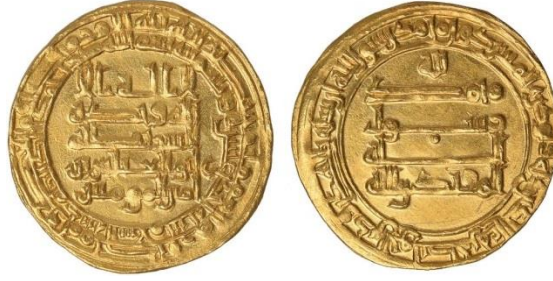
Fotoğraf 14: Halife Muktedir Dönemine ait H. 311 tarihli ve Medinetü's-Selam (Bağdat) baskılı dinar. 28

Muktedir ve Râzî Döneminde, Mu'temid ve Mütevekkil sikkelerinde olduğu gibi, ön yüzünde halifelerin “veliahtının”, arka yüzde “halifenin kendi adının” verildiği görülmektedir (Fotoğraf 14 -17).