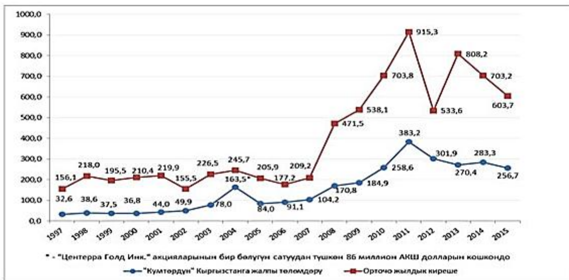
Сүрөт 1. Кумтөр компаниясынын экономикага салымынын жылдар боюнча динамикасы (млн. АКШ доллары)

«Кумтөр» компаниясынын өзүнүн эсептөөлөрү боюнча, жалпысынан компания иштеген 1994-2015-жж. аралыгындагы Кыргызстан аймагындагы төлөмдөрү 2,96 миллиард доллардан ашкан. Бул периоддо болжолдуу эсептөөлөр боюнча, компаниянын алтын сатуудан тапкан кирешеси 7,49 миллиард долларды түзгөн. Бул чоңдуктардын жылдар боюнча динамикасы сүрөт 1де чагылдырылды.