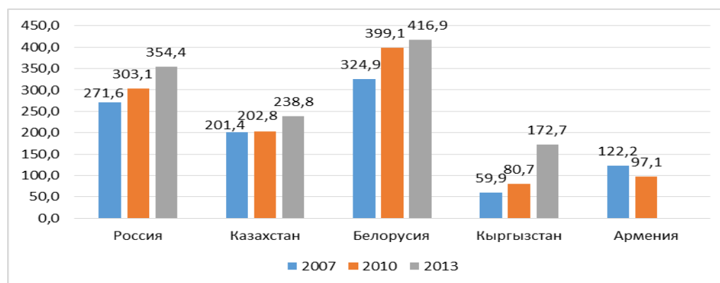
Сүрөт 1. 2007, 2010 жана 2013 жж. карата ЕАЭБке мүчө мамлекеттерде автотранспорт каражаттарынын саны (1000 кишиге)

Ал эми жол-кырсыктарынан каза тапкан мамлекет катары Казахстан эсептелип, ар бир 100 000 кишиден 30,6 киши каза тапкан (сүрөт 2).