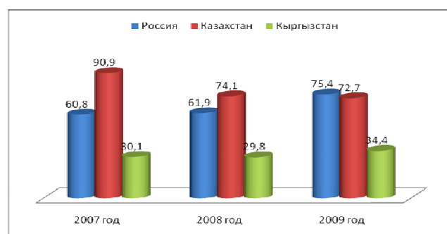
Рис.1. Отношение активов к ВВП, %

Исходя из данных рис. 1 [2, 3, 4], можно сказать, что рассматриваемый показатель для России в динамике имеет положительную тенденцию к увеличению: к 2009 г. он увеличился на 14,6% в сравнении с 2007 г. В Казахстане, наоборот, наблюдается резкое снижение показателя в 2009 г. на 18,2% в сравнении с 2007 г. В Кыргызстане происходит незначительное изменение данного показателя.