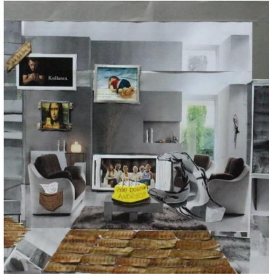
Resim 8. Öğrenci Çalışması 8

Kağıt üzerine kolaj tekniğinin kullanıldığı bu çalışma kapalı bir mekan içerisinde görülmektedir. Resimde koltuklar, duvarlarda resimler bulunmaktadır. Mekan lüks bir odayı yansıtmaktadır. Resmin tam ortasında büyük bir el figürü cep telefonu tutmaktadır. Cep