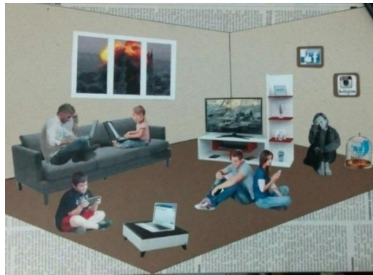
Resim 2. Öğrenci Çalışması 2

Kağıt üzerine kolaj tekniğiyle yapılan bu çalışmanın öncelikle ön yapısı değerlendirildiğinde şu sonuçlara varılabilir: Resimde kadın, erkek, çocuk ve gençler olmak üzere 6 figür görülmektedir. Çalışmada bir oda tasvir edilmiştir. Resimde televizyon,