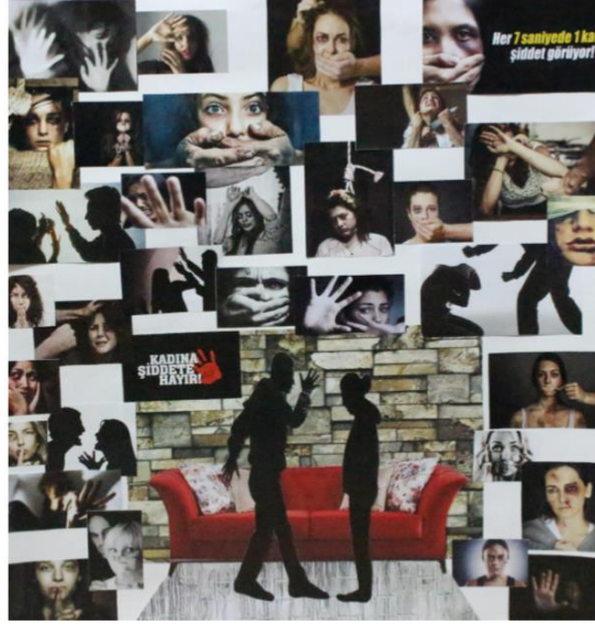
Resim 6. Öğrenci Çalışması 6

Kağıt üzerine kolaj tekniğiyle yapılan bu çalışmada yüzey birkaç farklı alana bölünerek düzenlenmiştir. Resimde kapalı bir mekân içerisinde erkek ve kadın figürleri bulunmaktadır. Resmin merkezinde kırmızı bir koltuk bulunmaktadır. Ön planda kadın ve erkek silüetleri görülmektedir. Arka planda kadın portreleri vardır. Çalışmanın konusuna ilişkin toplumda kadın figürünün temalaştırılmaya çalışıldığı söylenebilir. Özkan (2006: 32)'a göre günümüz popüler kültürü büyük oranda şiddete de dayalıdır. Belli televizyon programları ve kitaplar, belirli oranda şiddeti içermektedir. Bazı televizyon programlarında şiddet öyle ince olarak işlenmektedir ki, özellikle yansıtılmış şiddet önemli derecede popülerdir. Özellikle gücün ve kaynakların eşitsiz olarak dağıtıldığı, çatışan çıkar ortamlarının varlığı ile yapılandırılan toplumlarda yansıtılmış şiddet üzerinde durulmaktadır. Televizyondaki şiddet toplumdaki sınıf çatışmalarının somut bir temsili niteliğindedir.