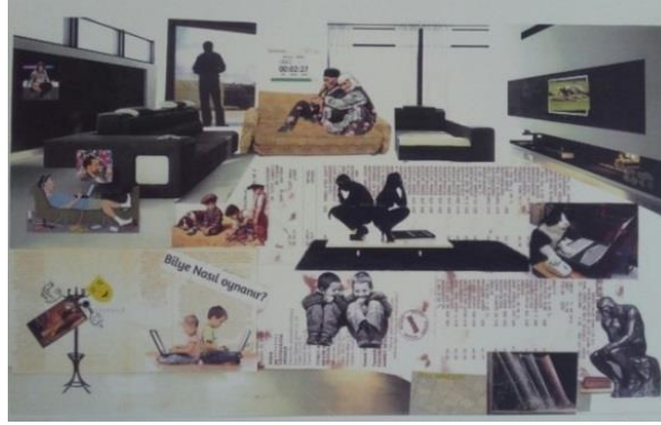
Resim 1. Öğrenci Çalışması 1

Kağıt üzerine kolaj tekniğiyle yapılan bu çalışmada yüzey birkaç farklı alana bölünerek düzenlenmiştir. Resimde kapalı bir mekân içerisinde kadın, erkek ve çocuk olmak üzere 14 figür kullanılmıştır. Bu figürlerden bazılarının geleneksel kıyafetlerinin olduğu, bazılarının ise daha modern yapıda olduğu anlaşılmaktadır. Resim bazı yazı ve sözcüklerle zenginleştirilmiştir. Resmin sol üst köşesinde ayakta duran bir erkek silueti pencereden dışarıyı izlemektedir. Resmin ortasında geleneksel kıyafetler giymiş yaşlı kadın adama sarılmaktadır. Bu durumun tersi olarak resmin merkezinde genç bir kadın ve erkek birbirlerine sırt dönmüş şekilde oturmaktadır. Çalışmanın sağ tarafında düşünen adam heykelinin görüntüsü bulunmaktadır. Yanında ise tozlanmış kitaplar vardır. Çalışmanın sol tarafında ise bilgisayarla uğraşan çocuk görüntülerine yer verilmiştir. Çalışmanın sağında ve solunda büyük televizyonlar bulunmaktadır. Yine sol tarafta ise bilgisayar, telefon gibi teknolojik aletlerin içinde uzanmış, kulaklık takmış bir genç görülmektedir.