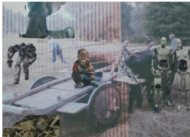
Resim 4. Öğrenci Çalışması 4