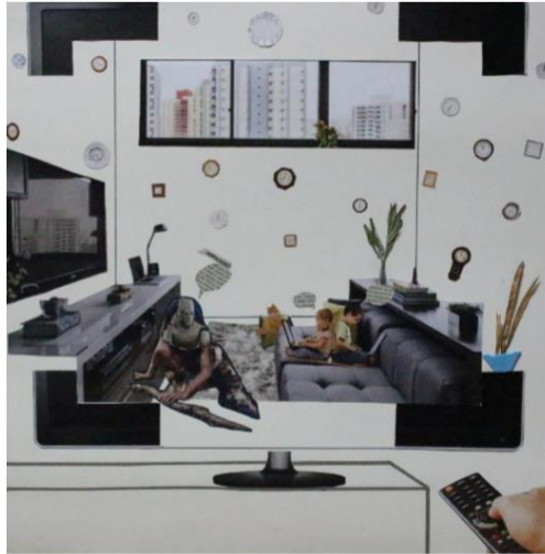
Resim 7. Öğrenci Çalışması 7

Kolaj tekniği ile yapılan bu çalışmada üç tane figür görülmektedir. Figürlerden iki tanesi çocuktur. Ellerinde bilgisayar görülmektedir. Televizyon ekranının içine yerleştirilmiş mekân görüntüsünde koltuklar, pencere ve duvarlarda asılı saatler görülmektedir. Resmin tam ortasında pencere ve pencerenin dışında görülen yüksek binalar bulunmaktadır. Figürlerin üzerine bazı kelimeler yerleştirilerek çalışma yazılarıyla desteklenmektedir. Çalışmanın