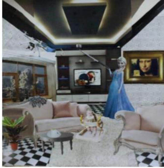
Resim 5. Öğrenci Çalışması 5

Kağıt üzerine kolaj tekniğiyle yapılan bu çalışmada kapalı lüks bir mekân görülmektedir. Çalışmanın sol tarafında geniş bir pencere, sağ tarafında elinde cep telefonu tutmuş Mona Lisa tablosu bulunmaktadır. Resmin merkezinde büyük oranda cindy bebek bulunmaktadır. Yine resmin merkezinde televizyon ve televizyon ekranında ölü çocuk görüntüsü bulunmaktadır. Ön planda renkli, abartılı koltuklarla hoş zengin bir ortam sağlanmıştır.