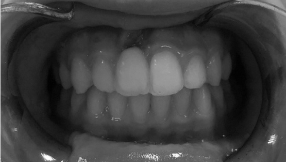
Resim 4. Hastanın 6. ay klinik görünümü