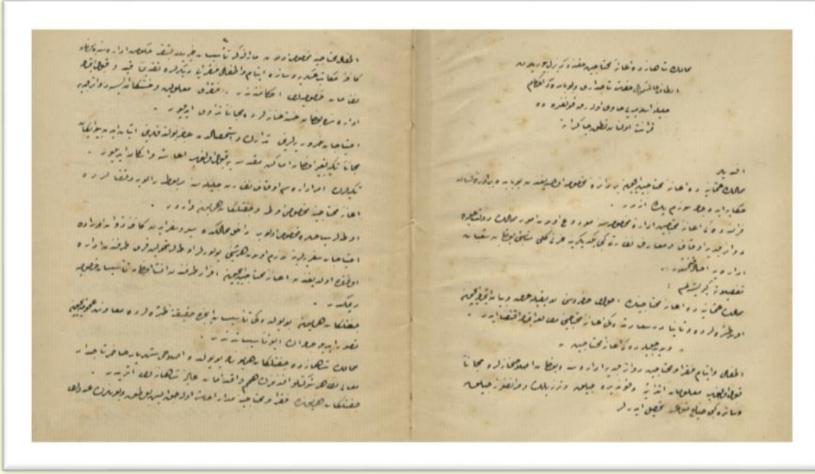
Resim 2: Paris Tıp Kongresinde İrad Olunan Nutuk'un ilk sayfası, İUNEK