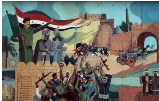
Resim 4. "Muzaffer" Konulu Propaganda Görseli

"Muzaffer" konulu propaganda görseli düz anlam boyutunda ele alındığında, görselde Saddam Hüseyin'in Irak'ın tarihi surları üzerinde elinde Irak Bayrağı'nı dalgalandırdığı görülmektedir. Saddam Hüseyin'in hemen yanında Kudüs fatihleri olarak Babil Sultanı II. Nebukadnezar ve Eyyübi Sultanı Selahaddin Eyyubi yer almaktadır. Surların hemen altında asker ve sivillerden oluşan bir kalabalık bulunmaktadır. Kinetik göstergeler içerisinde yer alan beden dili ve jestler incelendiğinde kalabalığın sevinç içerisinde olduğu yansıtılmaktadır. Surlar üzerinde Irak'ın farklı tarihi dönemlerini yansıtan kıyafetler içerisinde savaşçı görsellerine de yer verilmiştir.