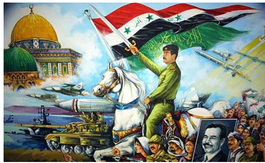
Resim 2. "Mücahit" Konulu Propaganda Görseli

"Mücahit" konulu propaganda görseli düzenlam boyutunda incelendiğinde, Saddam Hüseyin'in beyaz bir at üstünde elinde kılıç ile görselin merkezinde konumlandırıldığı görülmektedir. Görselin; üst kısmında, Irak Bayrağı, İslamiyet'i temsil eden yeşil bayrak, Mescid-i Nebevî ve Kubbet'üs-Sahra,sağ tarafında Saddam Hüseyin'in resmini taşıyan sivil ve askerlerden oluşan bir kalabalık, sol tarafında da tank, savaş gemisi, uçak ve füze görselleri yer almaktadır.