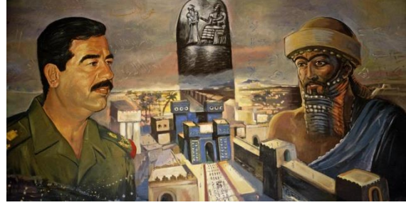
Resim 5. "Kahraman" Konulu Propaganda Görseli

"Kahraman" konulu propaganda görseli düzenlam boyutunda ele alındığında, görselde Irak'ın tarihi surları üzerinde Saddam Hüseyin'in ve M.Ö. 12. yüzyılda hüküm sürmüş olan Babil Sultanı I. Nebukadnezar'ın resmedildiği görülmektedir.