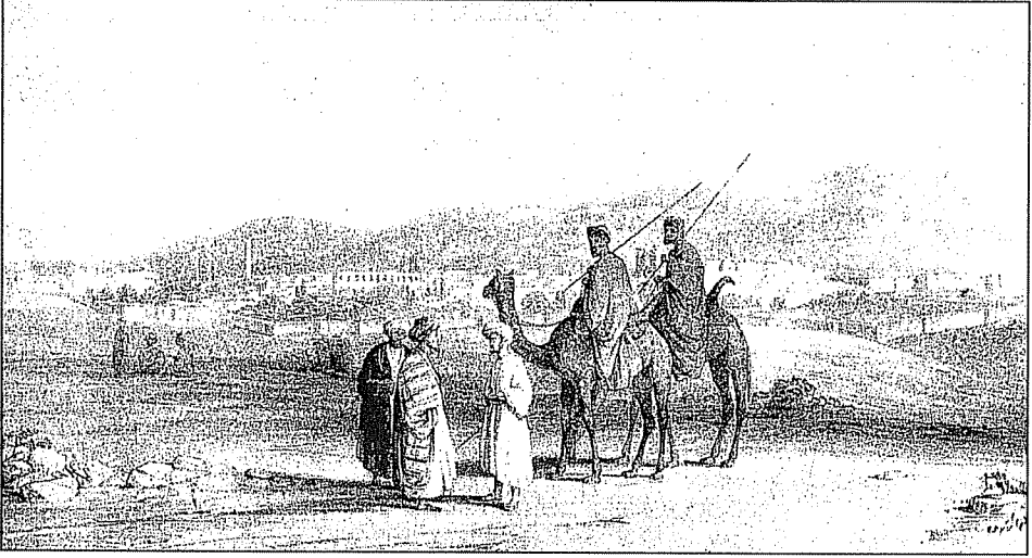
1830larda Urfa Şehri (Gravürlerle Türkiye V, Ankara 1997, Lev.188)