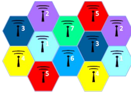
Şekil 1. Hücreli haberleşme sistemi örneği

Hata! Başvuru kaynağı bulunamadı. 'de her bir hücre grubu 7 baz istasyonundan oluşan hücre yerleşimi ve kanal tahsisi gösterilmiştir. Her bir renk farklı bir frekans kanalı veya kanal grubunu temsil etmektedir. Burada aynı renk ve sayıyla gösterilmiş baz istasyonları, birbirine komşu olmadığı için aynı kanal veya kanal grubunu kullanabilmektedir. Bu sayede tüm sistem için tahsis edilmiş frekans kanalları hücre grupları içerisinde birbirleri ile kesişmeyecek şekilde tekrar tekrar kullanılabilir [6].