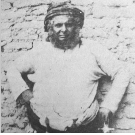
Ek 3 ve 4 Sultan Ali Muhsin bin Fadl ve Kaptan Stafford Bettesworth Haines.