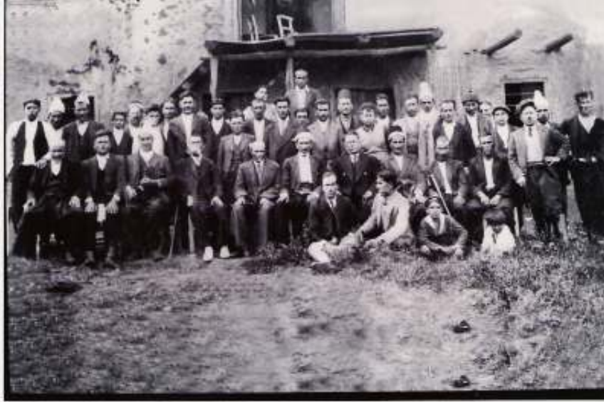
1937-1938'de açılan Aktepe Halkevi.