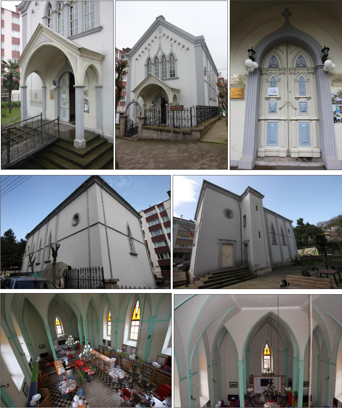
Şekil 8. Kapusen Kilisesinin cephe düzeni ve detaylarına ilişkin görseller, 2018