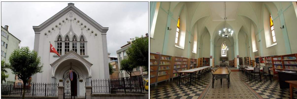
Şekil,6. Yapının giriş cephesi ve İç mekan görselleri, 2005

1988’de kilisenin etrafındaki bu yapıların kamulaştırılarak temizlenmesine ilişkin Trabzon bölge kurulunun kararı bulunmaktadır. Ancak kamulaştırma çalışmaları Rölove ve Tabiat varlıklarını Koruma Genel Müdürlüğü’nün 1992 tarihli raporuyla başlatılmış ve 1997’de tamamlanarak kilisenin anıtsal kimliği ön plana çıkartılarak, algısı ve cadde üzerinden görünürlüğü sağlanmıştır. Yapının sahip olduğu mimari değerın serbestçe izlenmesine ve uygun işlev değişikliğiyle kullanılmasına olanak sağlanmıştır (Şekil, 6). Bu süreçte yapının çan kulesi ve bahçesinde de değişiklikler yapıldığı kilise görsellerinden de (Şekil 4, 5) takip edilebilmektedir. Zamanla yapının çan kulesinin kısaltılarak yapıyla aynı yüksekliğe düşürüldüğü (Şekil, 4) ve bulunduğu parsel sınırlarının çevrilerek bahçe olarak düzenlendiği görülmektedir (Şekil, 6).