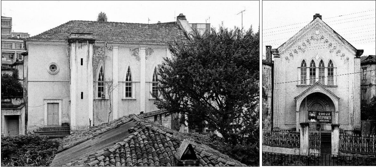
Şekil, 5. Kapusen kilisesinin görselleri, 1990

1988’de kilisenin etrafındaki bu yapıların kamulaştırılarak temizlenmesine ilişkin Trabzon bölge kurulunun kararı bulunmaktadır. Ancak kamulaştırma çalışmaları Rölove ve Tabiat varlıklarını Koruma Genel Müdürlüğü’nün 1992 tarihli raporuyla başlatılmış ve 1997’de tamamlanarak kilisenin anıtsal kimliği ön plana çıkartılarak, algısı ve cadde üzerinden görünürlüğü sağlanmıştır. Yapının sahip olduğu mimari değerın serbestçe izlenmesine ve uygun işlev değişikliğiyle kullanılmasına olanak sağlanmıştır (Şekil, 6). Bu süreçte yapının çan kulesi ve bahçesinde de değişiklikler yapıldığı kilise görsellerinden de (Şekil 4, 5) takip edilebilmektedir. Zamanla yapının çan kulesinin kısaltılarak yapıyla aynı yüksekliğe düşürüldüğü (Şekil, 4) ve bulunduğu parsel sınırlarının çevrilerek bahçe olarak düzenlendiği görülmektedir (Şekil, 6).