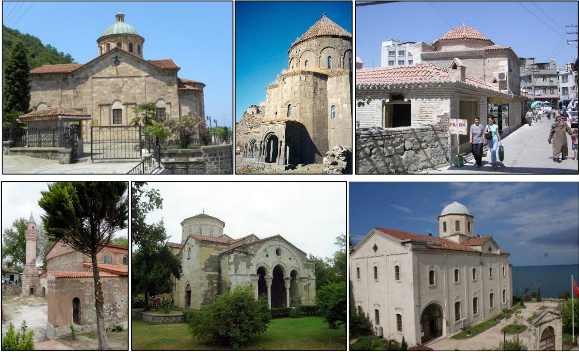
Şekil,1. İşlev değiştirmiş Kilise yapılarından bazıları (Giresun Gogora Müzesi; Kars Kümbet Camii; Adana Yağ Camii; İznik Ayasofyası; Trabzon Ayasofya Camii; Ordu Taşbaşı Kültür Merkezi)