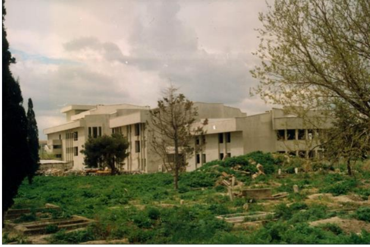
Resim 2: Kırklareli Kültür Merkezi (Z. KURTULMUŞ'tan)