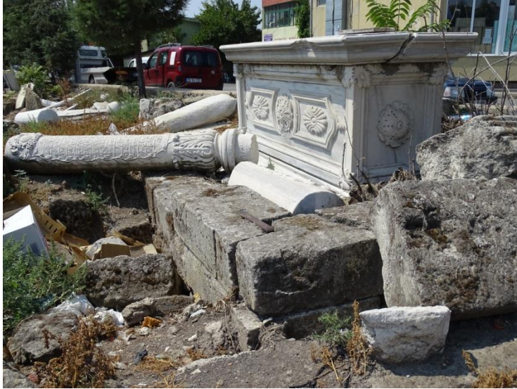
Resim 7: Kırklareli Eski Mezarlığı'ndan Çevirmeli Mezar Örneği, kenet sistemi detay