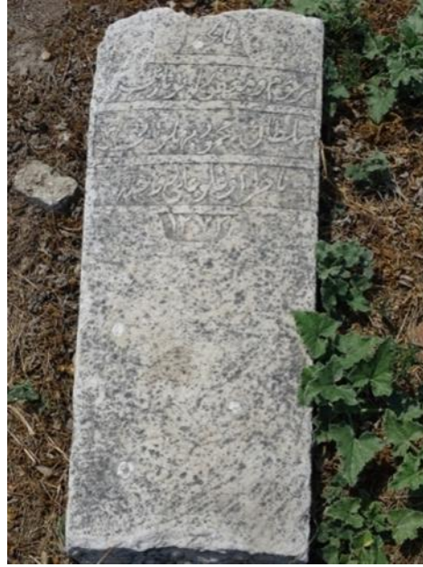
Resim 5: Pehlivan Ali'nin mezar taşı