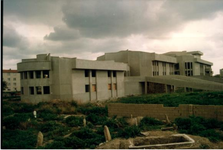
Resim 3: Kırklareli Kültür Merkezi (Z. KURTULMUŞ'tan)