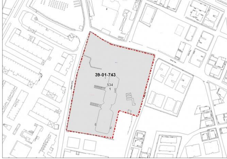
Çizim 2: Kırklareli Eski Mezarlığı günümüz sınırları (Kırklareli Envanteri'nden)