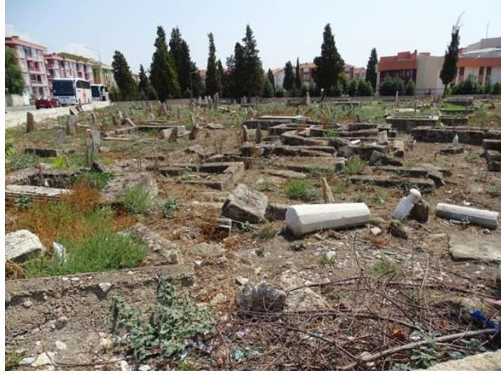
Resim 4: Kırklareli Eski Mezarlığı, günümüzdeki hali