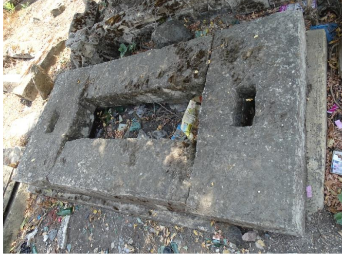
Resim 6: Kırklareli Eski Mezarlığı'ndan Çevirmeli Mezar Örneği