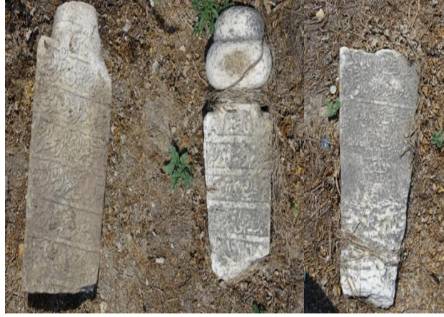
Resim 8: Kırklareli Eski Mezarlığı'nda Yer Alan Benzer Tarzda Mezar Taşları