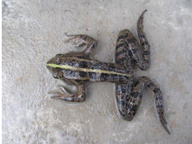
Şekil 1. Pelophylax ridibundus 'ta beslenme yetersizliğine bağlı zayıflık ve omurga eğriliği (Orijinal)

Kurbağaların erginleri böcek, solucan, küçük yumuşakçalar ve birçok başka küçük hayvan dâhil olmak üzere etçil beslenirken, larvaları sudaki alglerle ve ölü hayvan artıklarıyla beslenmektedir (Suykerbuyk vd., 2007, Cagiltay vd., 2014, Campião vd., 2015, D'Silva, 2015). Entansif yetiştiriciliği yapılan kurbağalar ise pelet yemlerle beslenmektedir (Miles vd., 2004, Real vd., 2005, Neveu, 2009). Gereksinim duyulan besin maddelerinin yeterli olmaması, yemlemenin uygun ve yeterli olmaması, boylamanın yapılmaması ve suyun fiziksel ve kimyasal özellikleri, gibi nedenlerle beslenme hastalıkları meydana gelebilmektedir. Beslenme hastalıkları arasında metabolik kemik hastalığı, hipervitaminosis D3, tiamin yetersizliği, yağ dokusu iltihabı, böbrek taşı, obesite, korneal lipidozis, zayıf bacak, felç, skolyoz, vücut anomalileri ve kaşeksi (Şekil 1) bildirilmiştir (Whitaker ve Wright, 2001).