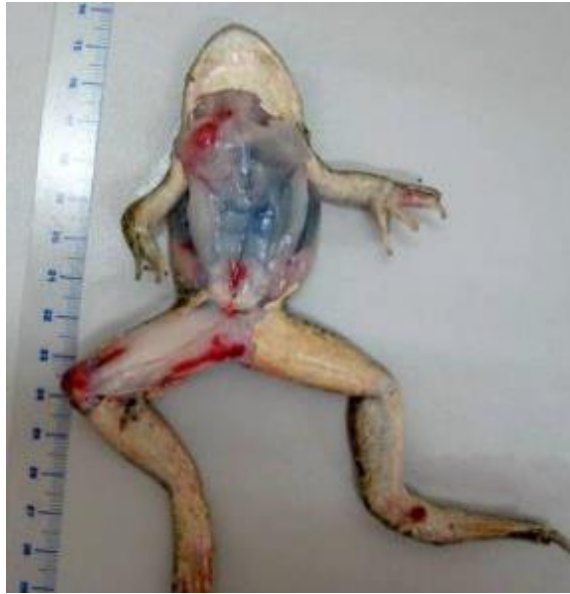
Şekil 2. Pelophylax ridibundus 'ta ekstremiteler, gövdede kızarıklık ve ülserler (Orijinal)