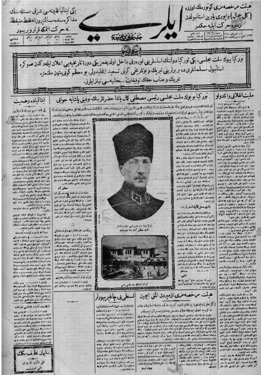
İleri, 4 Teşrin-i Sani 1338/4 Kasım 1922, nr. 1706: Sadrazam Ahmet Tevfik Paşa'nın telgrafi ve Mustafa Kemal Paşa'nın verdiği cevabın yer aldığı bir haber