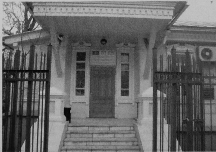
Türkiye Türkçesi Eğitim-Öğretim Merkezi (Almatı)

Kazakistan'ın ihtiyacı olan ara elamanların yetiştirilmesine yardımcı olmak, Türk Kültürü ile birlikte Türkiye Türkçesinin öğretilmesine katkıda bulunmak, milli, manevi, tarihi bağları güçlendirmek amacıyla "Almatı Türkiye Türkçesi Eğitim Öğretim Merkezi" açılarak 1997 yılında eğitim öğretime başlamıştır. "Almatı Türkiye Türkçesi Eğitim Öğretim Merkezinden bu güne kadar 1842'si kız ve 272'si erkek toplam 2114 kişiye çeşitli seviyelerde sertifika verilmiştir. 2009-2010 eğitim öğretim yılı başı itibariyle de; halen Merkezimizde; Bakanlığımızca görevlendirilen bir müdür, bir müdür yardımcısı ve 24 öğretmen olmak üzere 26 kişi görev yapmakta olup 917 kız ve 363 erkek olmak üzere toplam 1280 kursiyer bulunmaktadır.