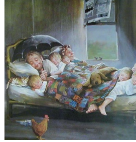
Örnek:2 Abidin Dino