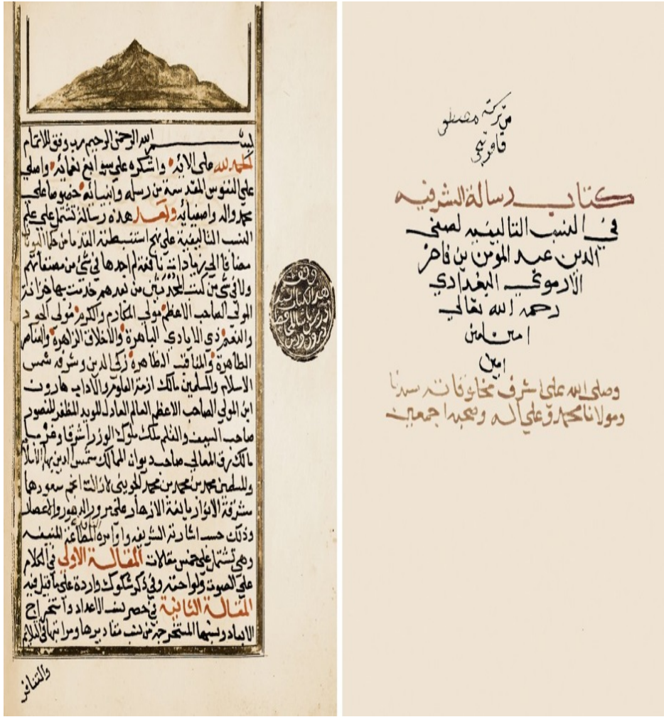
Şekil 1. er-Risâletü'ş-Şerefiyye Beyazıt Devlet Kütüphanesi Veliyyüddin Efendi nr.4524 6

Müellifin diğer eseri olan Kitâbu'l-Edvâr on beş fasıldan oluşmaktadır. "Birinci fasıl; nağmelerin tarifi, tizlik ve pestliğin açıklanması, ikinci fasıl; desâtinin kısımları, üçüncü fasıl; eb'adın oranları, dördüncü fasıl; tenâfür sebepleri, beşinci fasıl; mülâyimin açıklanması, altıncı fasıl; devirler ve oranları, yedinci fasıl; iki telin hükmü, sekizinci fasıl; ud tellerinin düzeni ve seslerin çıkarılması, dokuzuncu fasıl; meşhur devirler, onuncu fasıl; devirlerin nağmelerinin ortak sesleri, on birinci fasıl; devirlerin tabakaları, on ikinci fasıl; ud'da alışılmamış akortlar, on üçüncü fasıl; îkâ'nun devirleri, on dördüncü fasıl; nağmelerin etkileri, on beşinci fasıl; uygulamanın başlangıcıdır." 7