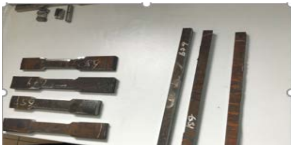
Şekil 5. Deney öncesi hazırlanan numuneler

Şekil 5'te hazırlanan numuneler gösterilmektedir. Çekme, eğme, çentik darbe ve sertlik deneyleri gerçekleştirilmiştir.