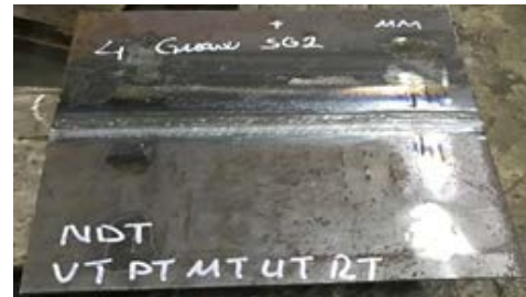
Şekil 2. Uygun kaynak parametreleri ile kaynak uygulaması tamamlanmış numune

Kaynak uygulamasından sonra numune görsel olarak kontrol edilmiştir. Şekil 2'de kaynak uygulaması tamamlanmış numune görülmektedir.