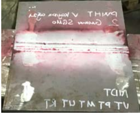
Şekil 3. Vt, Mt, Pt, Ut uygulanmış numune.

Standartlar referans alınarak tüm tahribatsız muayene gereklilikleri yerine getirilmiştir. Şekil 3'te tahribatsız muayene uygulanmış numune görülmektedir.