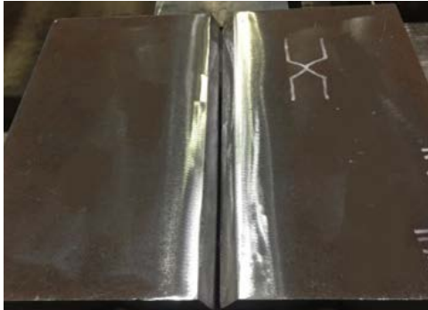
Şekil 1. Hazırlanan numune

Numune; EN 15613 ve EN 15614-1 standartlarına uygun olarak, 6x150x350 mm boyutlarında S355J2N yapı çeliği plakalara kaynak ağzı açılarak hazırlanmıştır. Şekil 1'de bu plakalar görülmektedir.