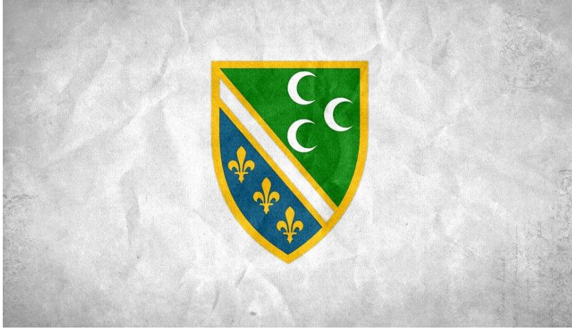
EK 3: Üç Hilâl şeklindeki Sancak Amblemi. http://www.bosna/hersek.ba/tarih-boyunca-sancakin-statusu/ , (EriŐim: 07.10.2017).