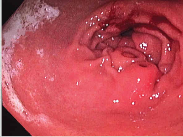
Resim 1. Mide antrumunda çift ektopik pankreasın gastrokopik görünümü.

Ektopik pankreas (EP), gastrointestinal sistemin herhangi bir lokalizasyonunda görülebilen konjenital bir anomalidir. Midede EP sık görülmeyen gastrik sumukozal lezyonlardır. Genellikle mide antrumunda, büyük kurvatur yerleşimli ve çoğunlukla asemptomatiktir. Üst GİS endoskopisi sırasında tesadüfen saptanırlar. Asemptomatik olmasına rağmen; bazen dispeptik yakınmalar, kanama, pankreatit ve kanser gelişimi ile kendini göstermektedir (1,2). Üst GİS'de tek EP olguları bildirilmiş olmakla birlikte; çift EP olgu sunumu oldukça nadirdir.