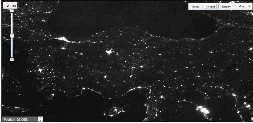
Şekil 1. Türkiye’nin 1999 yılı görsel parlaklık fotoğrafı (NOAA, 2018).

aydınlatmalarda kullanılan ışığın bir bölümünün uzaya gittiğini ve önemli bir bölümünün de atmosfere yayıldığını göstermektedir (Sullivan, 1991; Aslan, 1998; Cinzano vd., 2001; Aslan vd., 2011; NOAA, 2018). Şekil 1 ve Şekil 2’de, sırasıyla, Türkiye’nin 1999 ve 2010 yıllarında uzaydan çekilmiş iki fotoğrafı verilmiştir. Bu fotoğraflar artan ışık kirliliğini açıkça göstermektedir (NOAA, 2018).