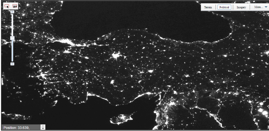
Şekil 2. Türkiye’nin 2010 yılı görsel parlaklık fotoğrafı (NOAA, 2018).

Sanayileşme ve nüfus artışıyla beraber büyük şehirlerde yapay ışık kaynakları da artmıştır. Kullanılan armatürlerin uygun seçilmemesi, yanlış yönlendirilmesi ve gereğinden fazla ışık üretmesi sonucunda, ışığın yatay doğrultu yerine gökyüzüne doğru dikine yayılması hem ışık kirliliği hem de enerji kaybı oluşturmak suretiyle aydınlatma maliyetlerini gereğinden fazla arttırmaktadır. Bu da doğal kaynakların