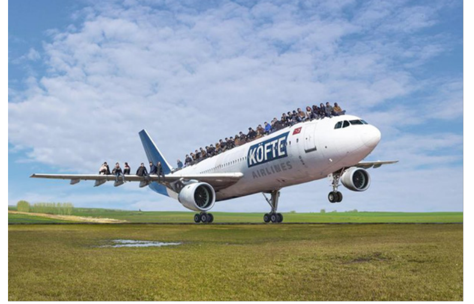
Görsel 12: Halil Altındere, Köfte Airlines, 2016, Fotomontaj

Altındere 2016 yılında açtığı “Uzay Mülteci” adlı sergisinde ise günümüzde revaçta bir konu olan ve milyonlarca insanı etkileyen Suriye iç savaşı sonucu dünyanın farklı ülkelerine dağılan mültecileri konu alır. Sergide hiçbir ülkenin kabul etmediği/etmek istemediği mültecilerin nereye gidecekleri sorusunu sorar ve milliyetçilik kavramlarını alaycı bir dille eleştirir. Sergide bulunan çalışmalarından “Köfte Airlines” ta sanatçı İstanbul-Tekirdağ yolu üzerinde bulunan bir uçak restorandı kullanır. Sanatçı restorana çevrilmiş eski uçağın üstüne anlaştığı 45 mülteciyi çıkararak fotoğraflar. Nereye gittiği belli olmayan bir uçağın üzerinde, o şekilde yolculuk yapması mümkün olmayan mültecilerin görüntüsü izleyiciyi yersiz yurtsuz olan göçmenlerin sorunları üzerine düşündürür. (Görsel 12)