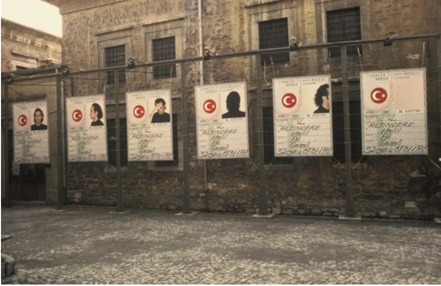
Görsel 11. Halil Altındere, Tabularla Dans/ Dans With the Taboos, 1997, Enstalasyon

nüfus cüzdanı üzerine bir çalışmadır. Bu çalışmada Altındere kendisinin 6 adet büyütülmüş nüfus cüzdanı kopyasını yan yana sıralamış ve üzerlerindeki vesikalik fotoğrafları değiştirmiştir. Sanatçı sosyal, kültürel ve politik kodları manipüle eden, devletin resmi belgesini yeniden tanımlayan ve tartışmaya açarken “ben devlete göre kimim, kim olmalıyım” sorusunu sorar. Mardin’de doğan olma kimliği ile İstanbul’da yaşayan ve üreten bir sanatçı olarak Altındere, Doğu-Batı ilişkisini ve Doğudan Batıya göçü devletin yaptığı tanımlama üzerinden sorgular (Görsel 11).