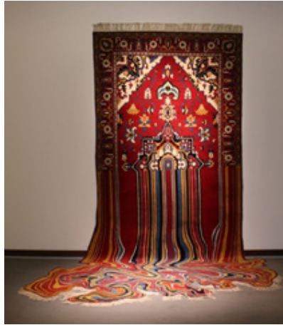
Görsel 9: Faig Ahmed, Akışkan/Liquid, 2014, Halı Dokuma

Faig 2014'te yaptığı “Akıcı/Liquid” adlı çalışmasında SSCB'nin yıkılışının Azerbaycan üzerinde yarattığı olumsuz etkileri anlatırken (Görsel 9), 2010'da yaptığı Geleneksel Pixel/Tradition Pixel çalışmasında günümüzde bilgisayar ekranındaki pixel kavramını halıların düğümleriyle eşleştirir. Halıların çağın koşullarını tarihsel bir süreç içerisinde gelecek kuşaklara aktardığı için bir tür iletişim aracı olduğunu söyler (Görsel 10).