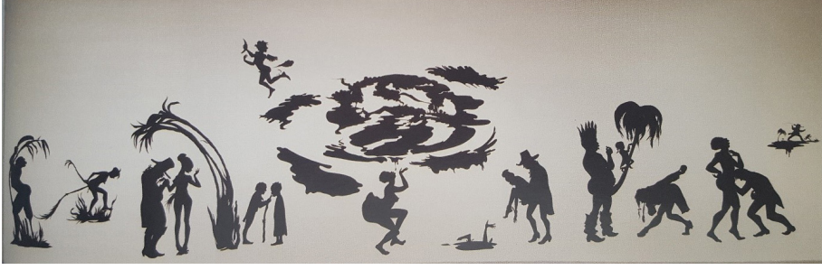
Görsel 8: Kara Walker, Köpek Balıkları İçin Kurtçuk Zenci Halkı İçin Ayrıcalık / Group of Sharks A Concession to the Negro Populace, 2004, Yağlıboya Resim.

görüyorum” der ve halının yapıldığı çağı temsil ettiğini söyler; “Halı, çağın sonucudur. 2500 yıl önce bile benzer desenler benzer teknikler vardı. Merkez ve sınırlar bildiğimiz her şeyin fikrini veren bir toplumsal yapıya benziyorlar.” 3