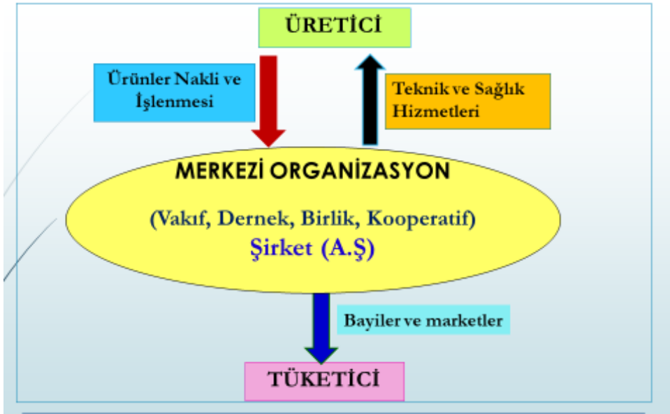
Şekil 2. Türkiye’de Hayvansal Üretim Geliştirilmesinde Üretici ve Tüketicinin Yararına Olacak Organizasyon Modeli