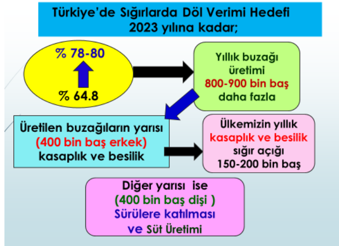
Şekil 1. Türkiye 2023 yılı yavru üretim hedefi

Ülkemizde sağılan inek başına doğan buzağı oranında en az %15 ‘lik bir gelişme imkanı olduğunu söyleyebiliriz (5-6 ilimizde bu oran %80’in üzerinde bulunmaktadır). Halen 5.4 milyon sağılan inek dikkate alındığında ve % 80 yavru elde edilmesi ile üretilen yıllık buzağı sayısının 3.4 milyon buzağının 4.3 milyon başa yükselmesi söz konusudur.